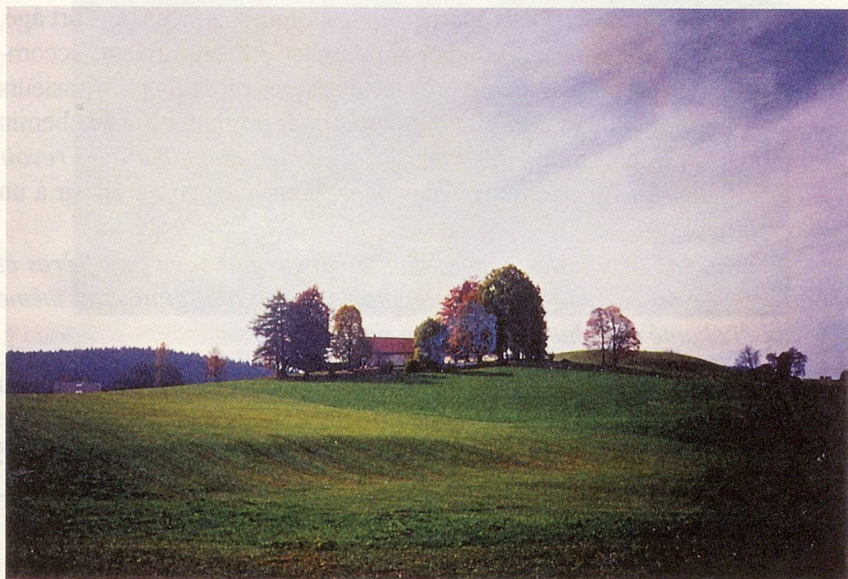
Fig. 1 Ferme Crozoz. Le domaine de la Cernaye au Crozot, ayant appartenu à la famille Jeanneret-Grosjean pendant 5 générations, de 1600 à 1772