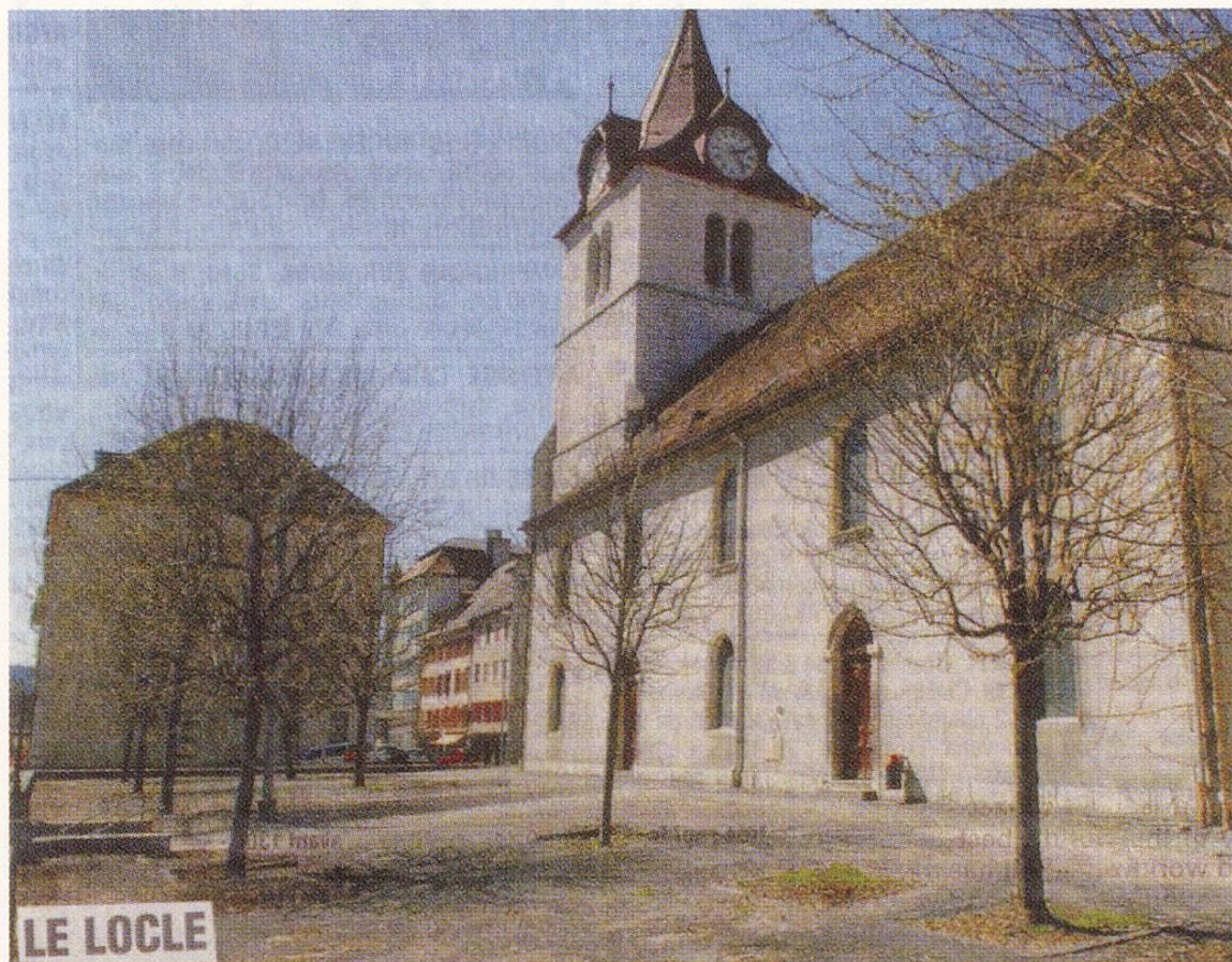
Fig. 3 Le Locle