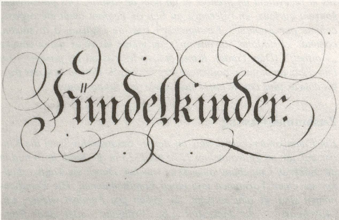
Abb. 1 Titelblatt des Findelkinder-Verzeichnisses Bern

Der Grund, warum eine Mutter ihr Kind aussetzte, war meist eine uneheliche oder aussereheliche Schwangerschaft. Sei es, dass sich der Vater aus dem Staub gemacht hatte oder bereits verheiratet war, jedenfalls waren diese Mütter der Überzeugung, dass fremde Menschen ihrem Kind eine bessere Erziehung angedeihen lassen könnten als sie selbst.