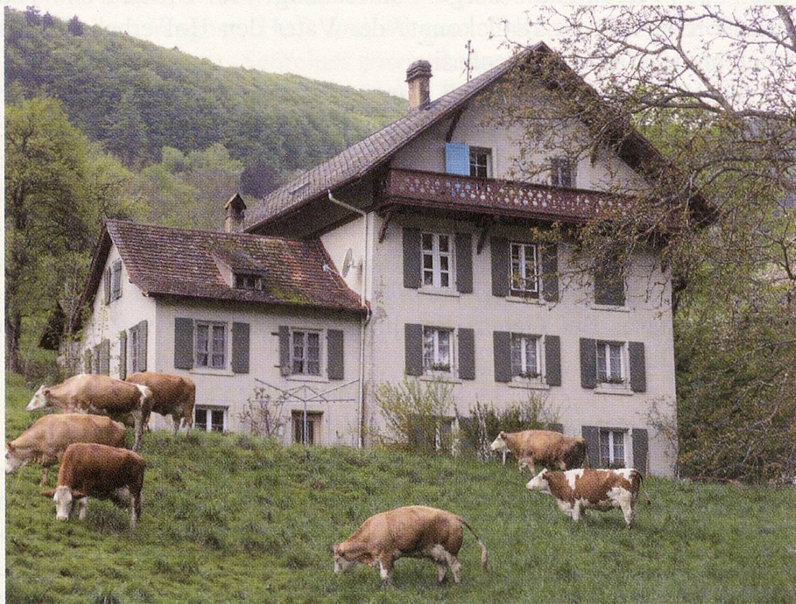
Abb. 3 Der Hof Unterer Dürrenberg heute