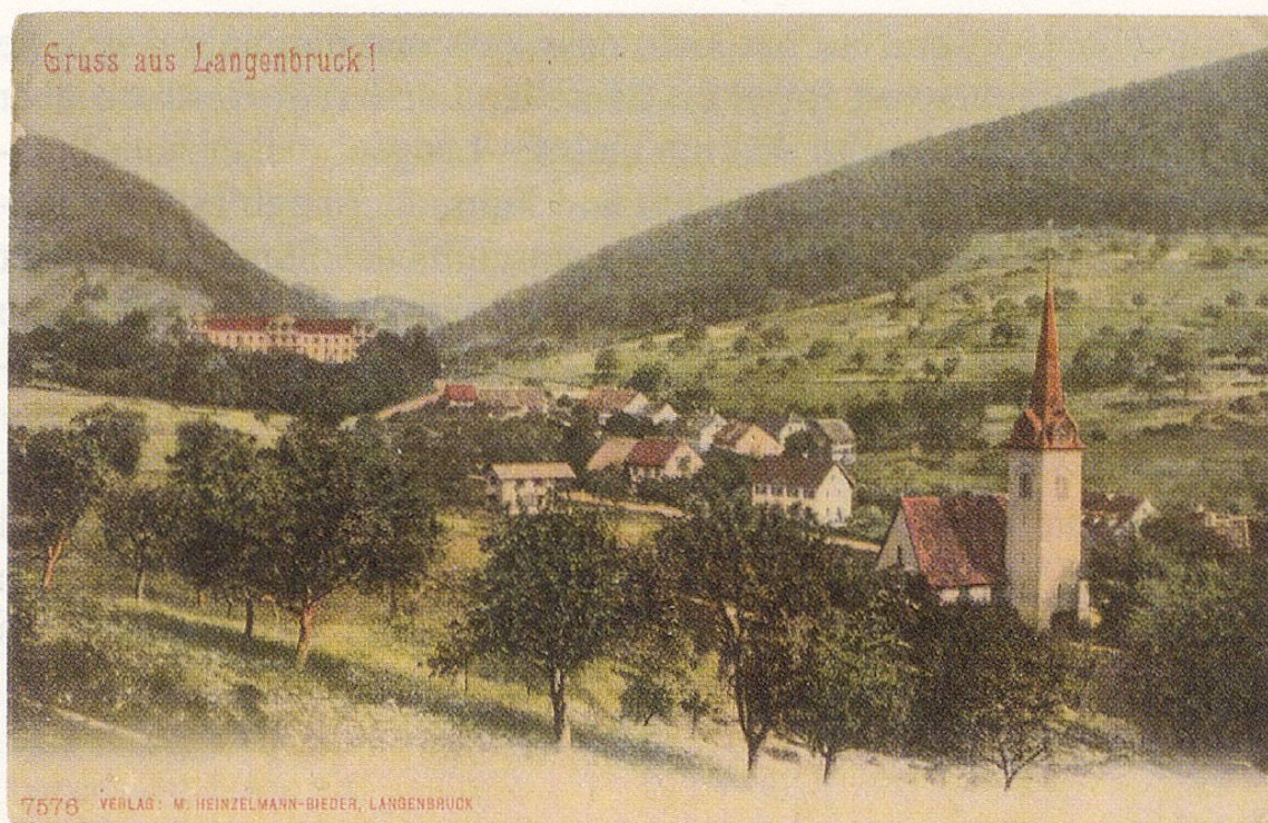
Abb. 1 Postkarte aus Langenbruck (Verlag M. Heinzelmann-Bieder, Langenbruck)