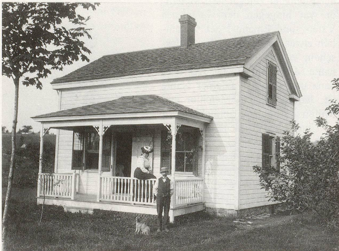
Abb. 7 Das Ehepaar Figi vor ihrem Haus in Marcellus

Das junge Ehepaar gründete seinen Hausstand in Marcellus im Onondaga County; ihr Haus stand etwas ausserhalb des Dorfzentrums (es wurde vor einigen Jahren abgerissen). Sie besaßen es pfandfrei 3 .