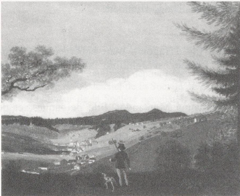
Fig. 2: Le Locle vers 1770

Jeanne-Marguerite mourra le 23 janvier 1741 au Locle. Elle avait épousé, le 8 décembre 1688 Claude Sandoz fils de Pierre communier du Locle, maistre-bourgeois de Valangin, nommé en 1695 justicier en l'honorable corps de justice du Locle, également gérant du Fonds de famille Sandoz créé en 1658.