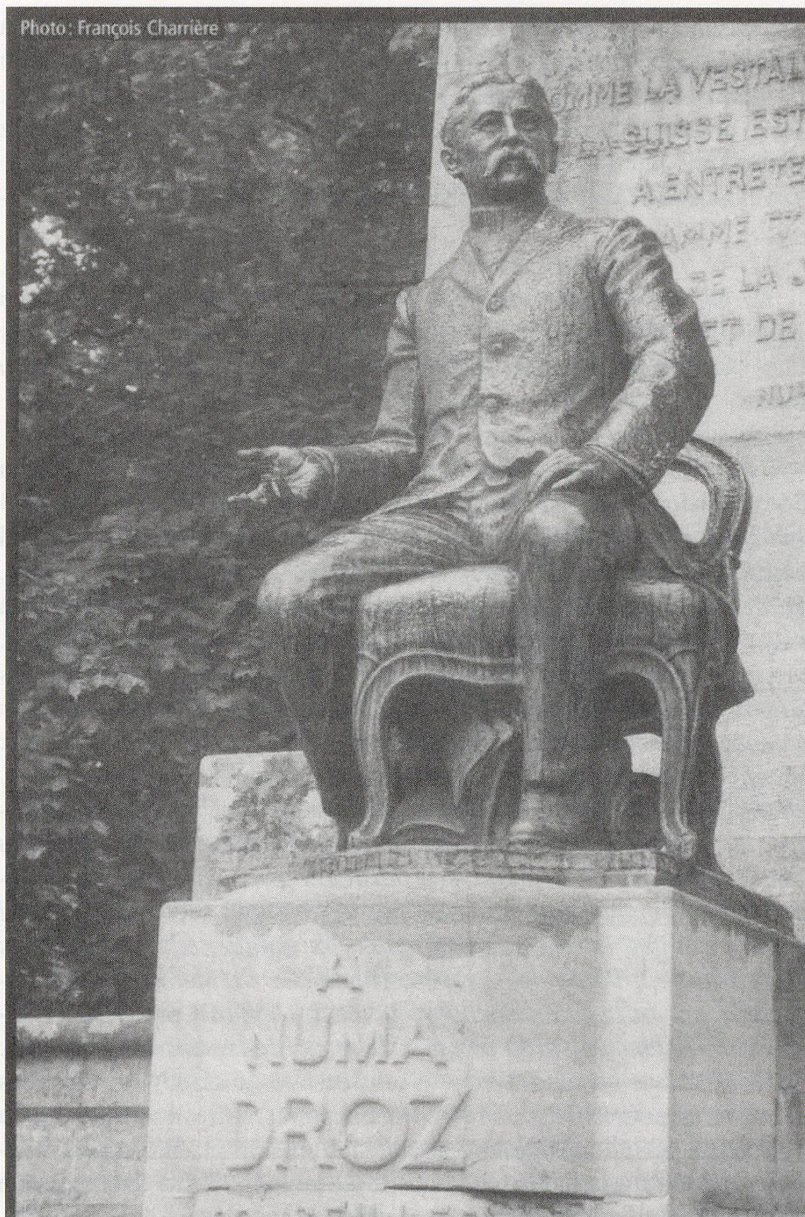
Fig. 1: Monument Numa Droz, Conseiller Fédéral, à la Chaux-de-Fonds, Courrier du Val-de-Travers hebdomadaire, année 2004