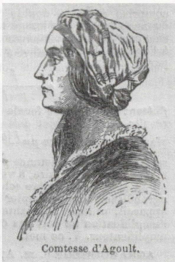
Fig. 1: Comtesse d'Agoult