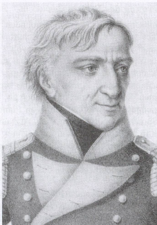
Abb. 3 Johann Gaudenz von Salis-Seewis (1762-1834), Generalstabschef der helvetischen Armee und Senator des Kantons Rhätien. Aus: Metz P.: Geschichte des Kantons Graubünden I, Chur 1989

Die Partei der Patrioten suchte für ihre Reformen die Unterstützung und den Rückhalt in der neuen französischen Republik, was für sie ebenfalls einer Kehrtwendung, weg von den Kaiserlichen, gleichkam.