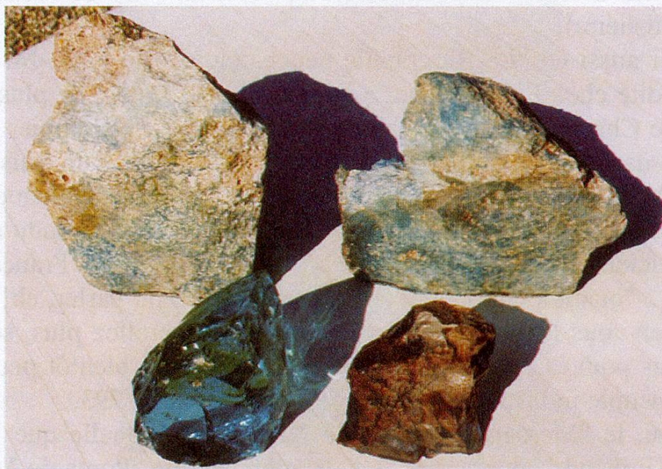
Fig. 2 Déchets de verre retrouvés derrière le four de la maison de Pierre Louis Guinand aux Brenets collection Pierre Deléglise, Les Brenets

réussit, le voilà bouëtier. Restant le cabinotier préféré des célèbres penduliers Jaquet-Droz, il se rend souvent à La Chaux-de-Fonds, "Sur le Pont" pour livrer ses cabinets de pendules, il a alors l'occasion d'y voir un très beau télescope anglais à miroir qui excite sa curiosité. Guinand manifeste son intérêt et dit son désir de pouvoir démonter ce télescope et de l'examiner; Pierre Jaquet-Droz accède à sa demande et lui met même entre les mains un premier traité d'optique; sachant à peine lire et ne parlant que le patois neuchâtelois, Pierre Louis déchiffre laborieusement l'ouvrage qui lui ouvre des horizons. Connaissant peu les mathématiques mais ayant déjà monté pour lui-même des verres sur ses propres lunettes, Guinand cherche à se procurer du verre de qualité et arrive à copier exactement ce télescope. Par la suite, entre 1784 et 1790, il acquiert des notions de chimie utiles à ses essais de vitrification; il emploie une partie de ses soirées à des essais variés, en fondant chaque fois, dans son fourneau à vent, plusieurs kilos de verre. A chaque expérience, il a soin de noter les teneurs et les composants, les temps de fusion,