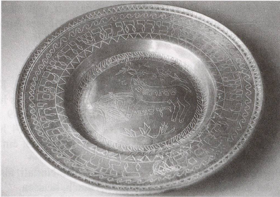
Abb. 4 Zinnteller für Hirsch = Hirtz = Naftali. Die Inschrift auf dem Teller lautet übersetzt: Renne wie ein Hirsch. Jahrzahl 1786

Mit fortschreitender Assimilation wurden auch die Vornamen angeglichen. Aus Josua wurde Georges, aus Schönele Jeannette, aus Breinle Brunetta, aus Chaim Heinrich.