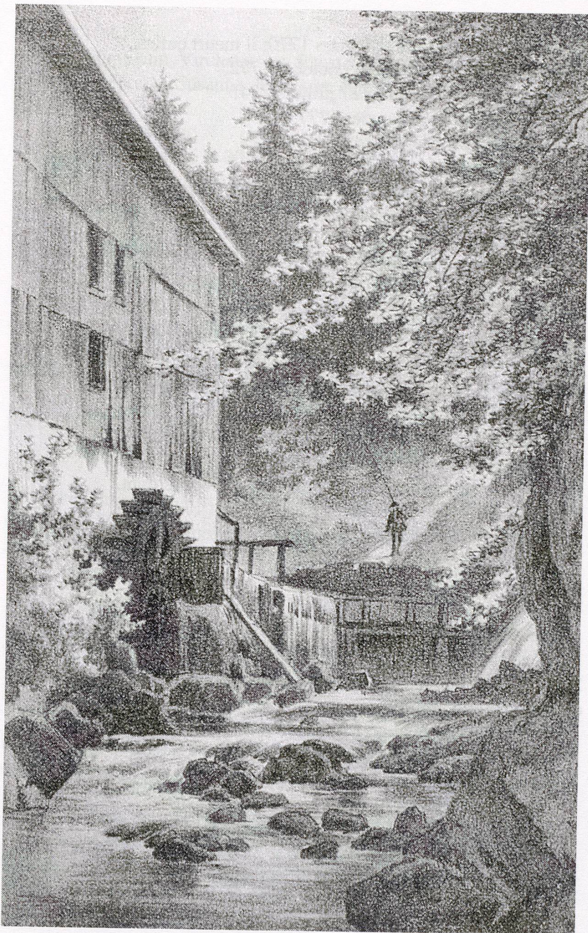
Fig. 2 Sources de l'Areuse à St. Sulpice