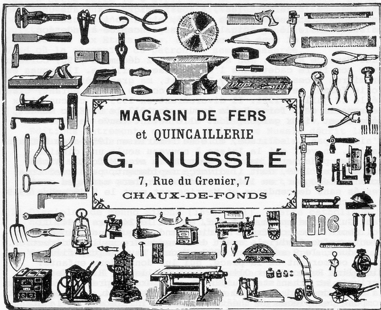
Publicité pour le magasin en 1900