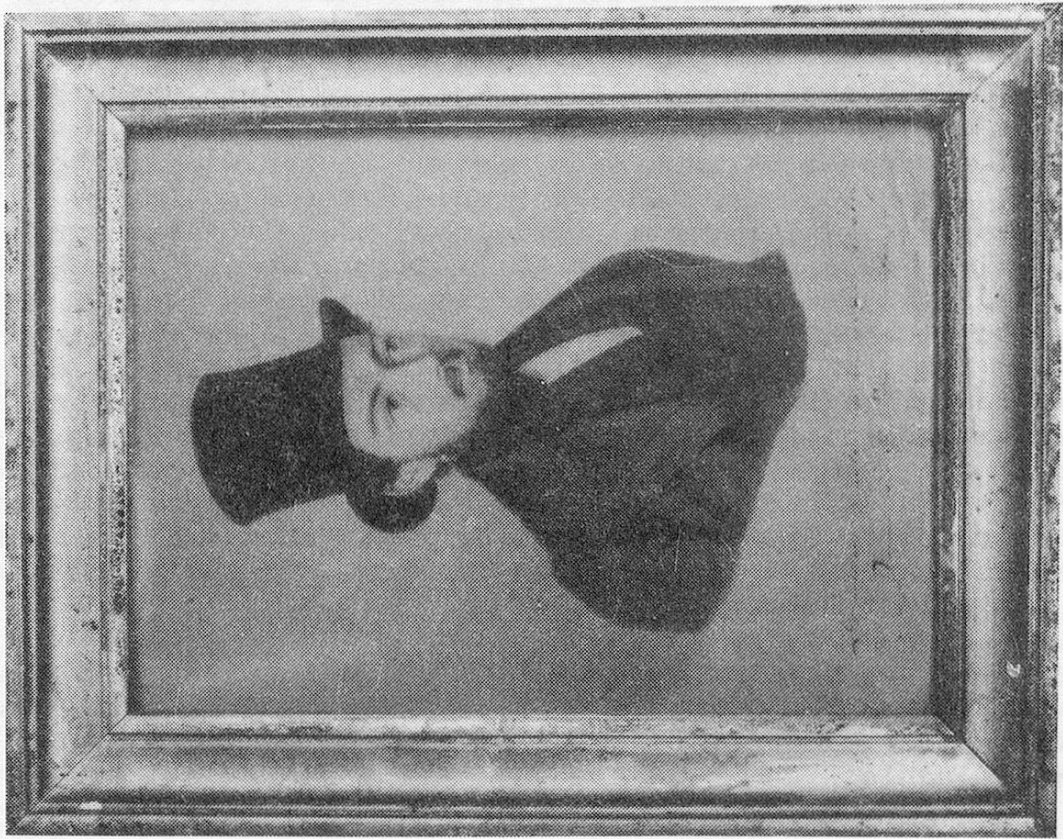
Abb. 2 + 3