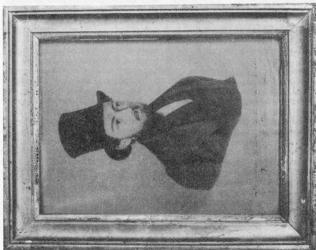
Abb. 2 + 3