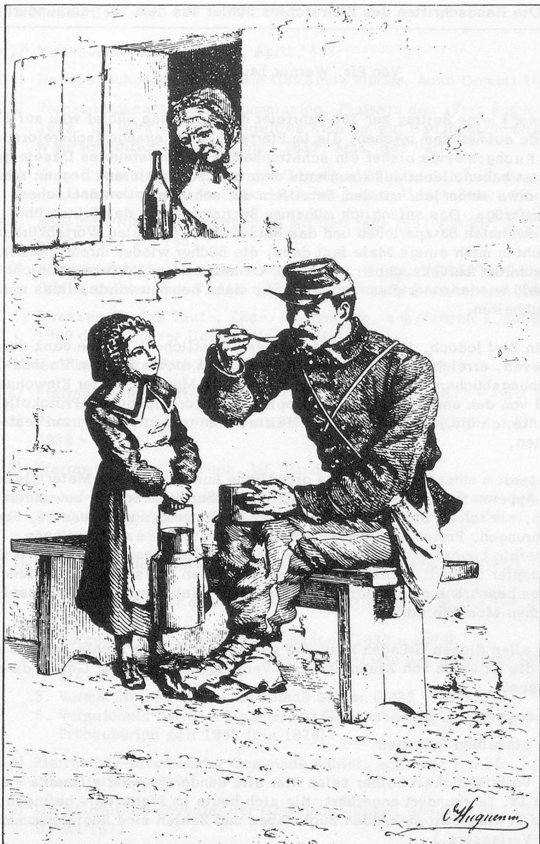
... C'était un solide gaillard aux traits accentués et énergiques ... (soldat bourbaki) (dessin d'Oscar Huguenin, tiré du livre «Derniers Récits», p. 101).