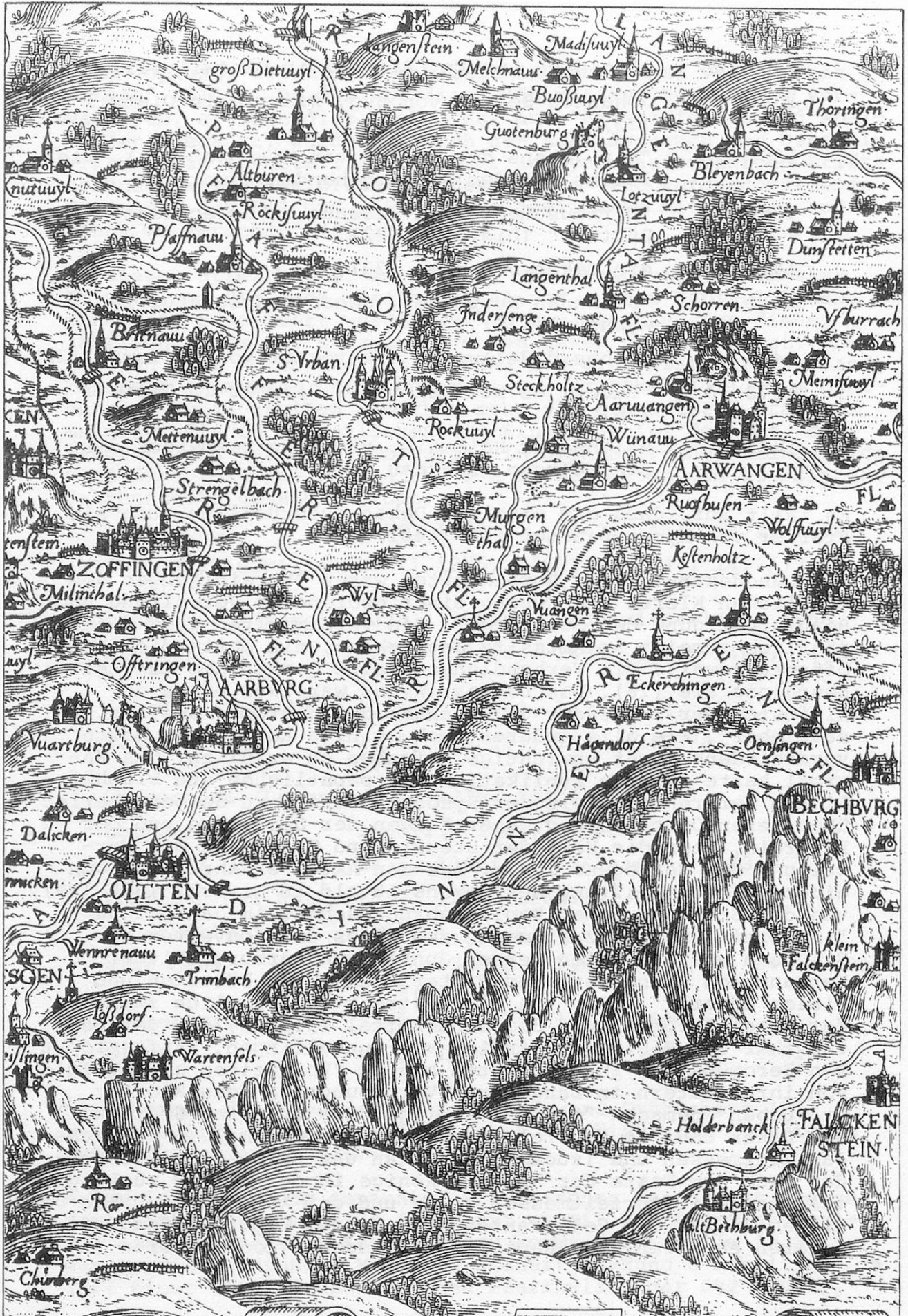
Thomas Schoepf: Karte des Bernischen Staatsgebietes 1777/78 (Ausschnitt, Staatsarchiv Bern)