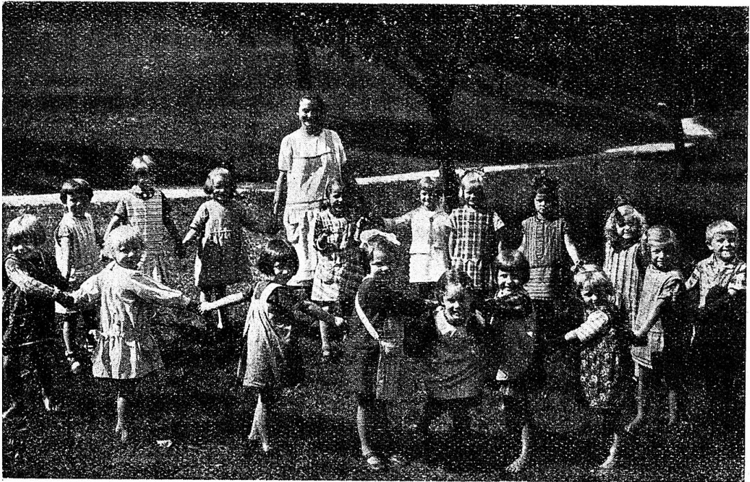
Kindergärtnerin und Kinder spielen auf der grünen Wiese.

den Verein in Kontakt gebracht mit Kreisen, die eine vermehrte Wertung des Fraueneinflusses anstrebten. In ihren Fusstapfen sind ihre Nachfolgerinnen weitergegangen und so kommt es, dass heute kaum ein Frauenwerk in unserem Lande geschaffen wird, bei dem man nicht auch die Mitwirkung der Lehrerinnen gesucht und gefunden hätte. Und dabei vollzieht sich ein schöner Wechsel in Geben und Nehmen. Der Schweizerische Lehrerinnenverein muss sich so mit einer Reihe von Fragen beschäftigen, die sich in seinem eigenen Tätigkeitsgebiet nicht stellen würden. Das bedeutet aber eine Erweiterung des Horizontes für diejenigen, die die Geschäfte leiten, und für diejenigen, an die sie die Kunde von all diesen Dingen weitergeben. Möge es dem Schweizerischen Lehrerinnenverein so gelingen, einer Gefahr zu entgehen, der eine Berufsorganisation so leicht erliegt, nämlich der Gefahr, alles nur vom Blickpunkt des eigenen Standes aus zu betrachten und damit der Wirkungsmöglichkeiten auf das Gemeinschaftsleben aller verlustig zu gehen.