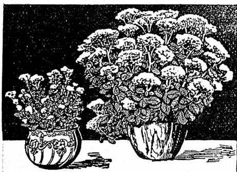
ohne und mit Fleurin