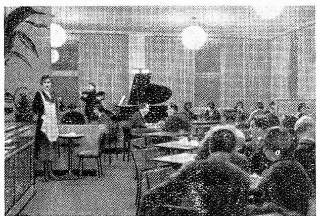
Blick in's Tea-Room „Bäreck“ Bern, beim Abendkonzert

Room Bäreck, dessen Terasse über dem Getriebe des belebtesten Punktes der Bundestadt liegt. Rechts aussen im weissen Kreis an der Aarberggasse 23, die seit 50 Jahren berühmte Berner Confiserie Oppliger & Frauchiger unter deren Leitung der Tea-Room „Bäreck“ steht.