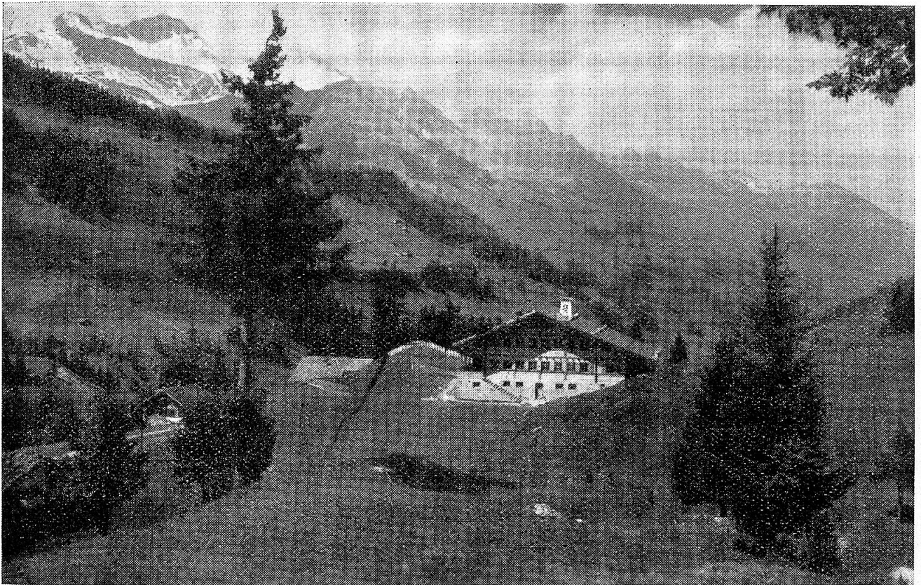
Internationales Pfadfinderinnen-Heim Chalet Eggetli, Adelboden

etwa blindlings die Knabenbewegung gleichen Namens kopiert. Es ist eine ausgesprochene Jugendbewegung und umfasst in der Hauptsache Mädchen vom 11.—20. Altersjahre. Politisch und religiös neutral stellen sich alle unter die gleiche freiwillige Disziplin. Die Uniform hilft gewisse Unterschiede überbrücken und gibt ein starkes Gefühl der Zusammengehörigkeit. In wöchentlichen Zusammenkünften möchte die Bewegung die