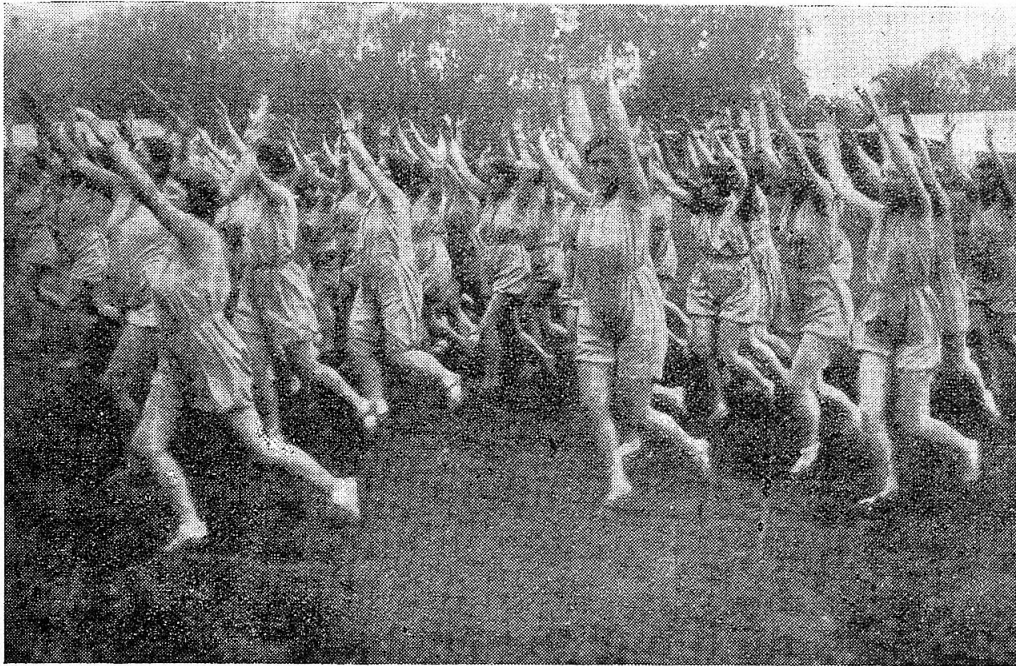
Vom eidgenössischen Turnfest in Aarau.