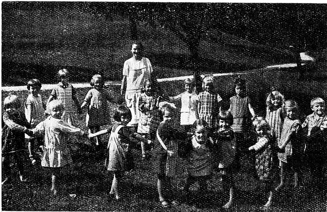
Kindergärtnerin und Kinder spielen auf der grünen Wiese.

den Verein in Kontakt gebracht mit Kreisen, die eine vermehrte Wertung des Fraueneinflusses anstrebten. In ihren Fusstapfen sind ihre Nachfolgerinnen weitergegangen und so kommt es, dass heute kaum ein Frauenwerk in unserem Lande geschaffen wird, bei dem man nicht auch die Mitwirkung der Lehrerinnen gesucht und gefunden hätte. Und dabei vollzieht sich ein schöner Wechsel in Geben und Nehmen. Der Schweizerische Lehrerinnenverein muss sich so mit einer Reihe von Fragen beschäftigen, die sich in seinem eigenen Tätigkeitsgebiet nicht stellen würden. Das bedeutet aber eine Erweiterung des Horizontes für diejenigen, die die Geschäfte leiten, und für diejenigen, an die sie die Kunde von all diesen Dingen weitergeben. Möge es dem Schweizerischen Lehrerinnenverein so gelingen, einer Gefahr zu entgehen, der eine Berufsorganisation so leicht erliegt, nämlich der Gefahr, alles nur vom Blickpunkt des eigenen Standes aus zu betrachten und damit der Wirkungsmöglichkeiten auf das Gemeinschaftsleben aller verlustig zu gehen.