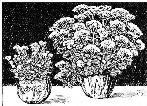
ohne und mit Fleurin