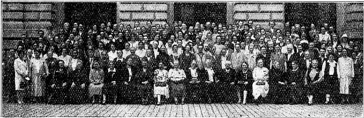
Delegierten-Versammlung des Schweizerischen Hebammenvereins anlässlich der „Saffa“ in Bern 1928.

Es war im August des Jahres 1881, als eine erste schweizerische Versammlung von Freunden der Fröbelschen Kindergartensache in St. Gallen die Gründung eines schweizerischen Kindergartenvereins beschloß. St. Gallen war ja die Wiege des Kindergartens in unserem Lande: dort hatte im Jahre 1870 Hedwig Zollikofer den ersten schweizerischen Kindergarten eröffnet. Zur Ausführung der einleitenden Schritte wurde eine Kommission eingesetzt, bestehend aus Dekan Mayer in St. Gallen, Schuldirektor Küttel in Luzern, Pfarrer Bion in Zü-