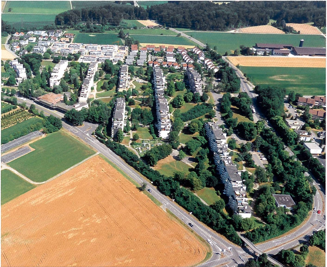
Flugaufnahme 2013