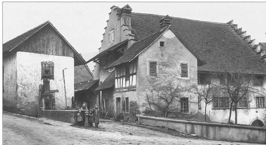
Bild 5: Aufnahme von Südwesten 1928. Der Brunnen steht noch an der Strasse vor der Einfahrt zum Mühlehof.