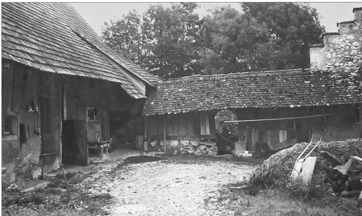
Bild 6a: Blick in den Mühlehof auf Verbindungsgang und Scheune, 1964