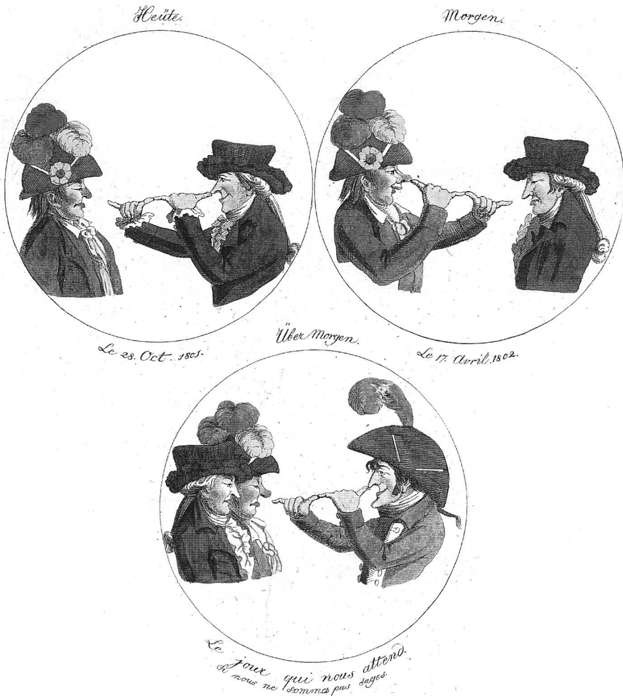
Bild 7 Karikatur um 1802. 1801 zeigt der Aristokrat dem Bürger die lange Nase, 1802 ist es umgekehrt und zukünftig wird es Napoleon sein, der vom Streit zwischen den Schweizern profitiert.