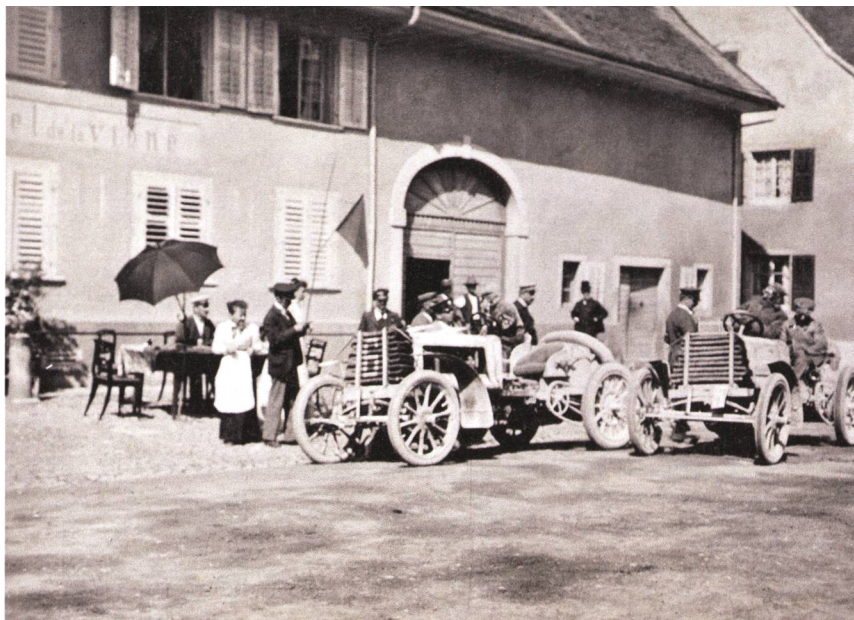
«M Farman No 6» vor den «Rebstock»-Gebäuden.