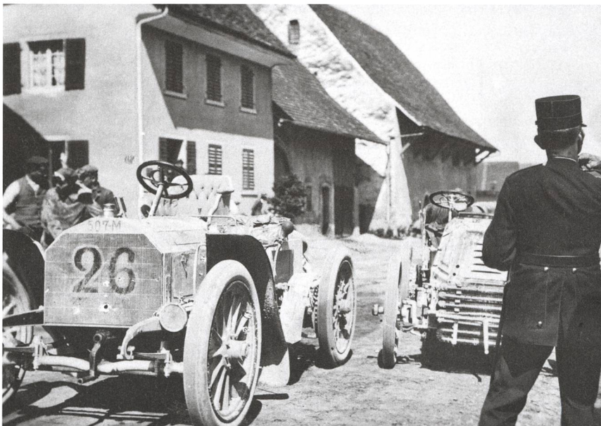
«Zborowsky a / Mercedes No 26» vor dem heutigen Haus Binkert (links) und der 1940 abgebrannten Weintrotte (nachher Gemeindehaus 1950, heute Polizeigebäude).