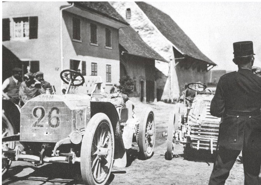
«Zborowsky a / Mercedes No 26» vor dem heutigen Haus Binkert (links) und der 1940 abgebrannten Weintrotte (nachher Gemeindehaus 1950, heute Polizeigebäude).