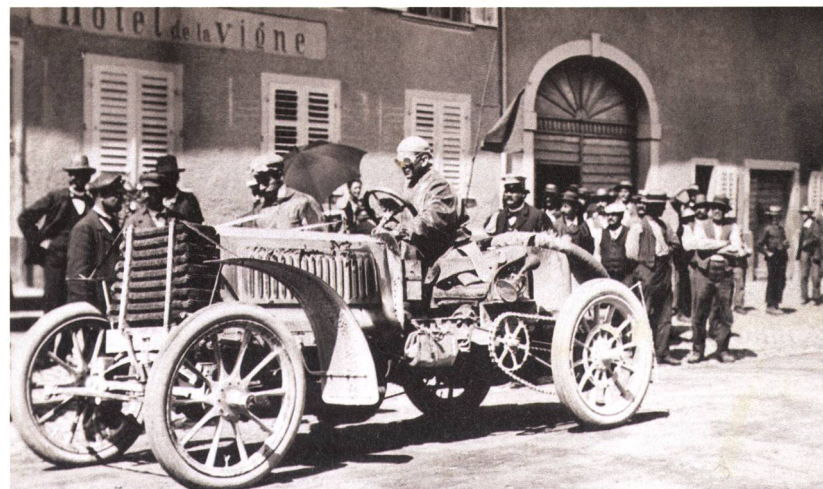
«Panhard» vor dem «Rebstock», bzw. «Hôtel de la vigne».

Die «Volksstimme» kritisierte zudem: Das vorgeschriebene Tempo von 30 Kilometern pro Stunde wurde jedenfalls im freien Gelände nicht eingehalten, denn wie erzählt wird, legten einzelne Fahrer die Strecke vom Hochgericht bis zur Möhlener Sandgrube (zirka 3 Kilometer) in 1 Minute und 25 Sekunden zurück. Die Durchfahrt in Rheinfelden dauerte bis Abends 7 Uhr, wobei 112 Fahrzeuge gezählt wurden. Der kritische Kommentator rang sich schliesslich doch zur Feststellung durch: Interessant, aber nicht gerade schön war das Schauspiel. Dennoch konnte er dem Spektakel, obwohl dieses die Bevölkerung sichtlich bewegte, wenig Positives abgewinnen: Wie Mumien nahmen sich die mit Schutzbrillen versehenen und staubigen Gestalten auf den dahersausenden Gefährten aus. Jedenfalls ist solch ein Fahrer, wenn er diese tolle Jagd einige Tage lang mitgemacht hat, mehr tot als lebendig.