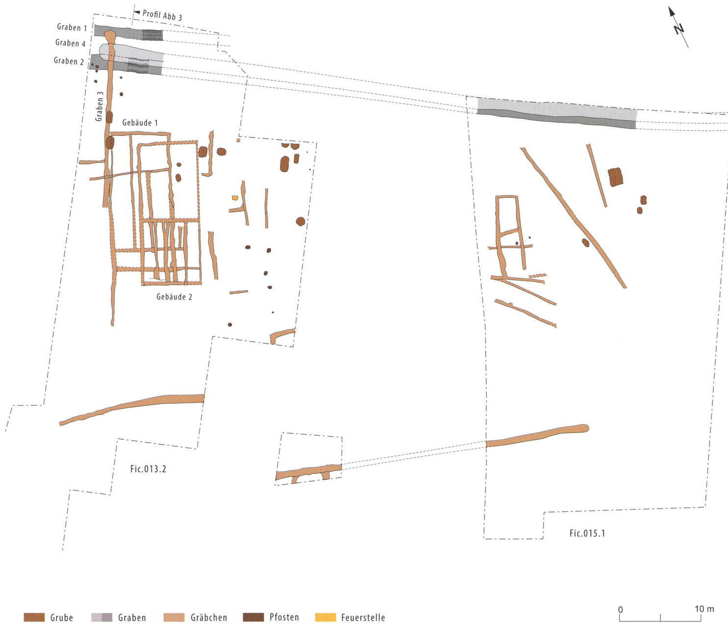
Frick-Gänsacker 2013-2014 (Fig.013.2) und Frick-Ob em Dorf 2015 (Fig.015.1). Älteste römische Befunde.