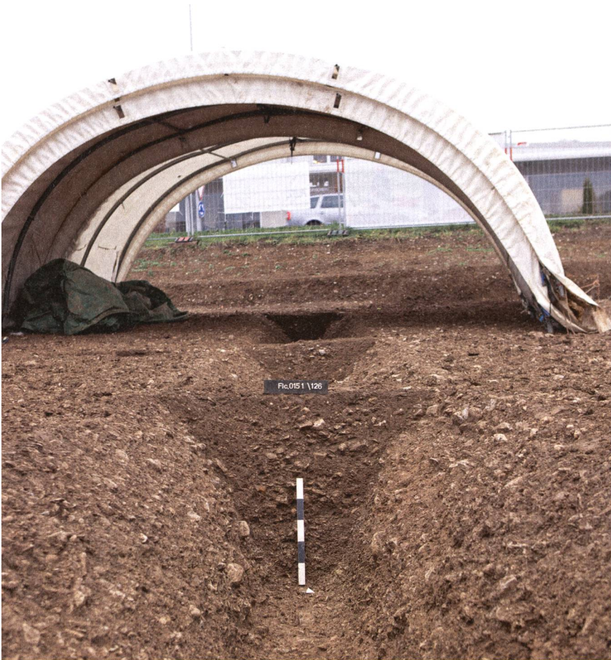
Frick-Ob em Dorf 2016 (Fig. 015.1). Blick auf den entnommenen Spitzgraben der späten Umwehrung. (Kantonsarchäologie Aargau)

Aus der 2. Hälfte des 4. Jhs. liegen lediglich noch drei Prägun- gen vor, die auf eine nur noch sporadische Begehung des Are- als hinweisen. Das Abbrechen der Münzreihe in der Mitte des 4. Jhs. kann im Zusammenhang mit den kriegerischen Ereignissen in den 350er Jahren, bei denen auch das Castrum Rauracen- se zerstört wurde, gesehen werden. 22 Die mit Gräben und einer Palisade befestigte Anlage lässt sich gut mit jenen 1986 beim Bläsihaus erfassten Befunden vergleichen. Eine weitere Parallele ist der spätrömische Getreidespeicher von Rheinfelden-Augar-