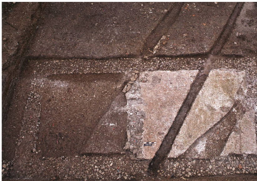
Frick-Ob em Dorf 2015 (Fic.015.1). Die beiden annexartigen Räume des nördlichen Gebäudes.

Bis auf mehrere Gruben und zwei Feuerstellen war dieser unbebaut, und seine Oberfläche war bekiest.