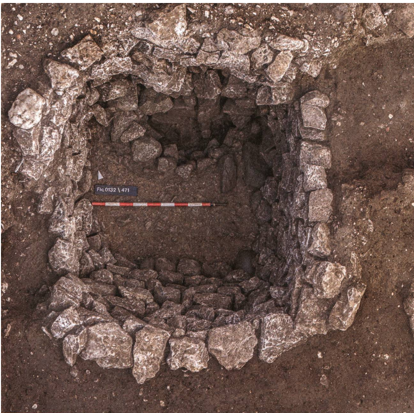
Frick-Gänsacker 2013-2014 (Fic.013.2). Ein Schacht in einem Hinterhof.

alle beigabenlos. Die Säuglinge wurden in Seiten- oder Rückenlage beigesetzt. Bei einer der Bestattungen könnten die engangliegenden Extremitäten Hinweis auf eine Wickelung des Säuglings sein. Gemäss den anthropologischen Untersuchungen der Skelette wurden hier peri- bis postnatal Verstorbene beigesetzt.