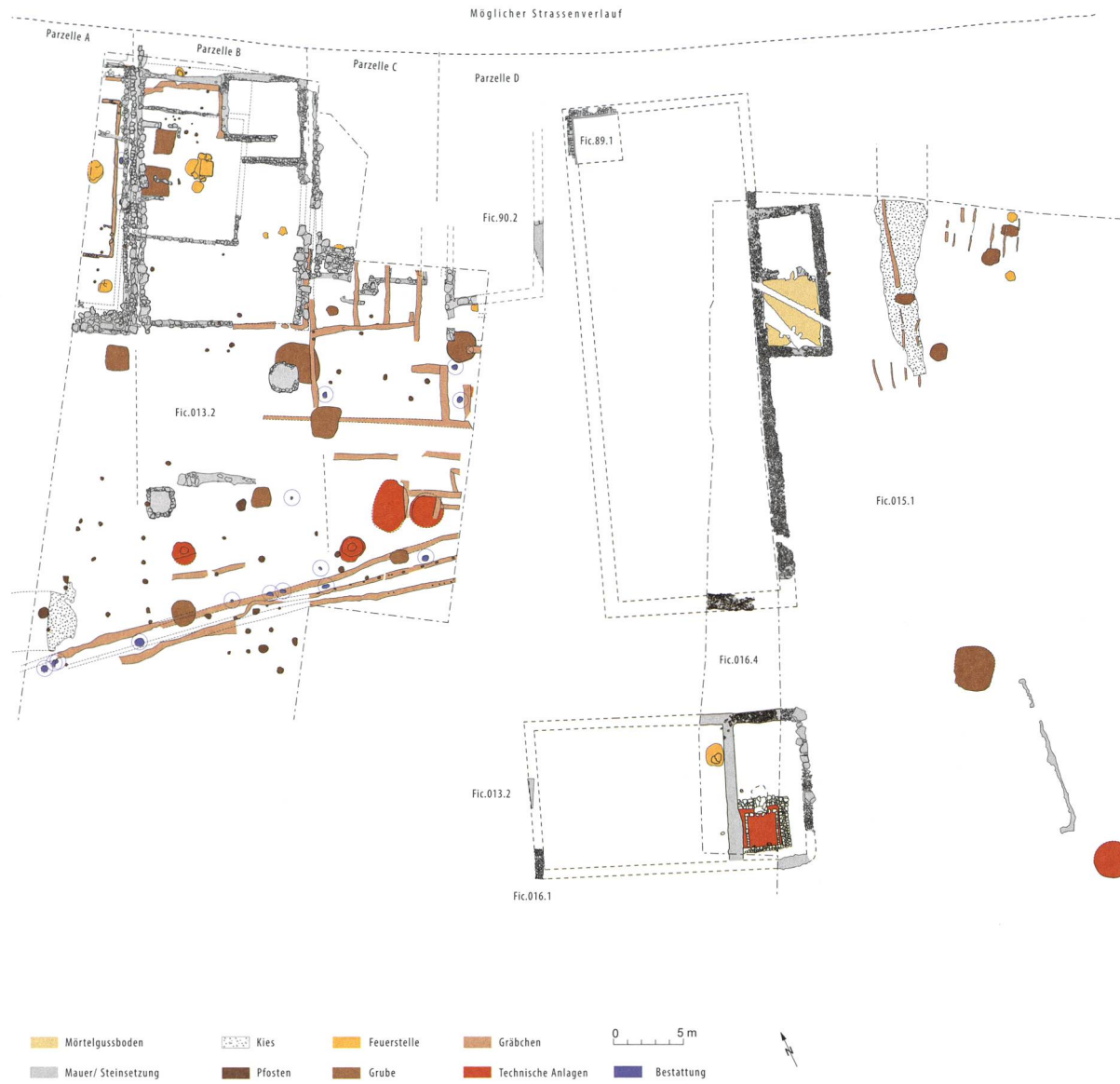
Frick-Gänsacker 2013-2014 (Fig.013.2), Frick-Ob em Dorf 2015 (Fig.015.1) und Frick-Ob em Dorf 2016 (Fig.016.4). Streifenhausbebauung und Gebäudekomplex.