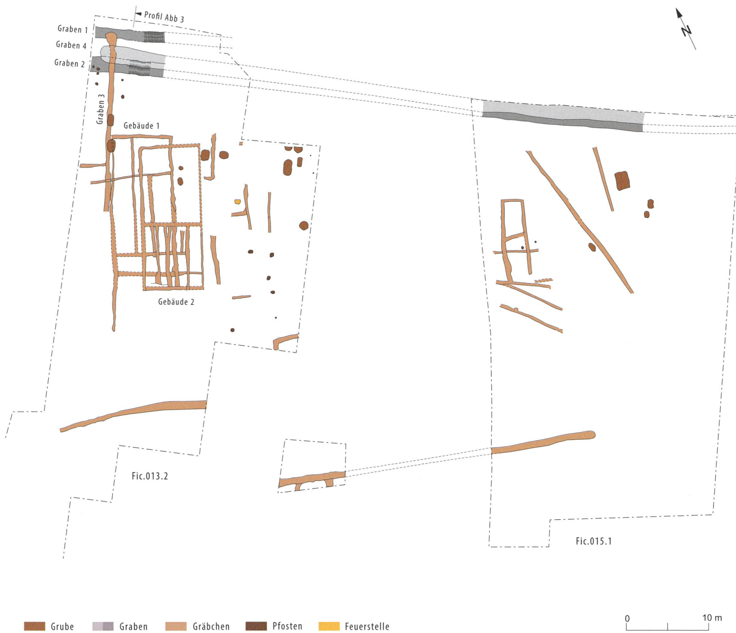
Frick-Gänsacker 2013-2014 (Fig.013.2) und Frick-Ob em Dorf 2015 (Fig.015.1). Älteste römische Befunde.