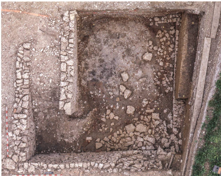
Frick-Gänsacker 2013-2014 (Fic.013.2). Der freigelegte Steinkeller.

In den dazugehörigen Hinterhöfen kamen Gruben, Schächte und technische Anlagen zum Vorschein. Die beiden Schächte waren rechteckig, mit Trockenmauerwerk eingefasst und bis zu 3.47 m tief.