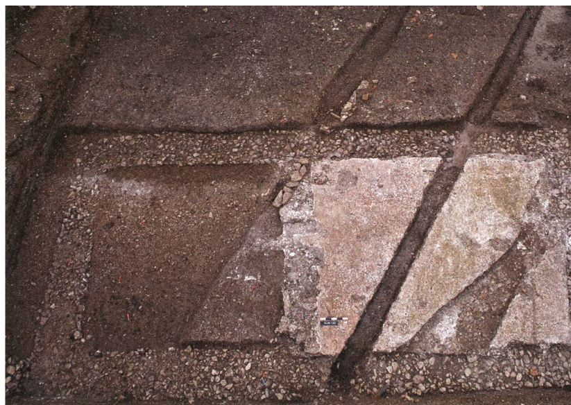
Frick-Ob em Dorf 2015 (Fic.015.1). Die beiden annexartigen Räume des nördlichen Gebäudes.

Bis auf mehrere Gruben und zwei Feuerstellen war dieser unbebaut, und seine Oberfläche war bekiest.