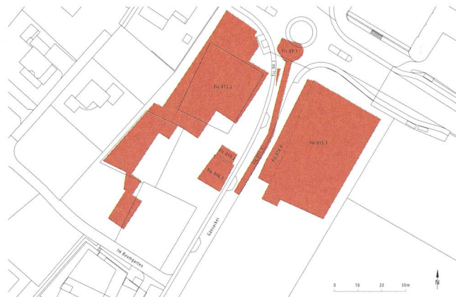
Plan von Frick mit Lage der Grabungen. (Kantonsarchäologie Aargau)

Die Grabungsflächen liegen am Ostrand von Frick in der Flur «Ob em Dorf» und wurden seit dem Mittelalter ausschliesslich landwirtschaftlich genutzt. Dementsprechend gut war die Erhaltung der archäologischen Strukturen. In der Antike befand sich hier gemäss unserem Kenntnisstand der Ostrand der römischen Siedlung von Frick. Die Siedlung, von der weder ihr Name 2 noch ihr rechtlicher Status bekannt sind, lag an jener wichtigen Fernstrasse, die die Colonia Augusta Raurica via den Bözberg mit Vindonissa verband.