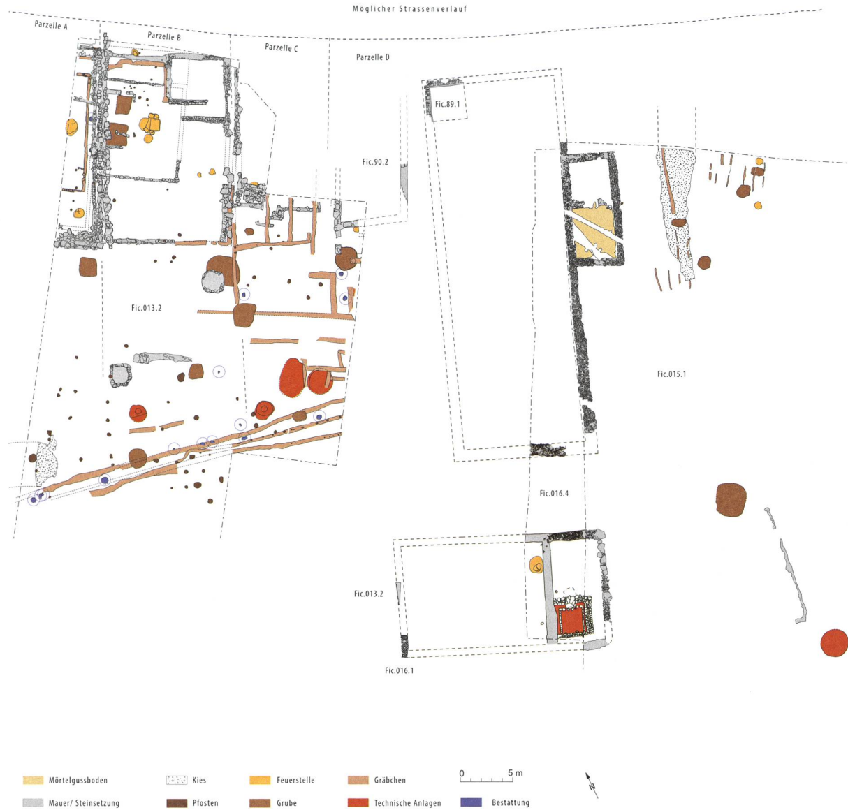
Frick-Gänsacker 2013-2014 (Fig.013.2), Frick-Ob em Dorf 2015 (Fig.015.1) und Frick-Ob em Dorf 2016 (Fig.016.4). Streifenhausbebauung und Gebäudekomplex.