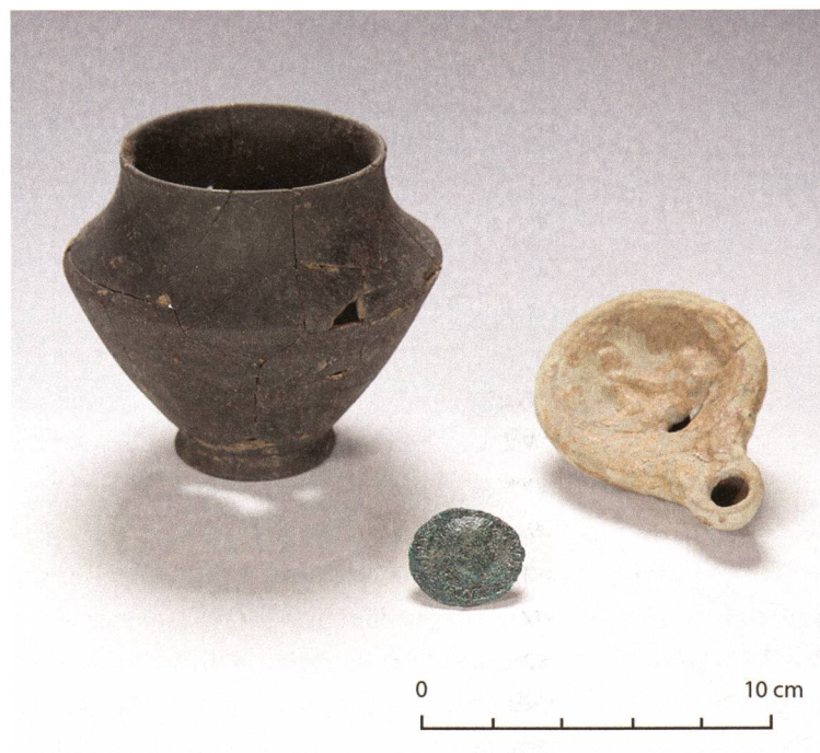
Frick-Gänsacker 2013-2014 (Fic.013.2). Beigaben aus einem Brandgrab.

Die Lage dieses Grabes belegt einerseits, dass hier der Ostrand der römischen Siedlung erfasst wurde. Andererseits ist davon auszugehen, dass sich entlang der Hauptverbindung nach Vindonissa ein weiteres Gräberfeld bzw. eine Gräberstrasse erstreckte. Damit lässt sich nun die Lage von zwei Gräberfeldern des römischen Frick belegen.