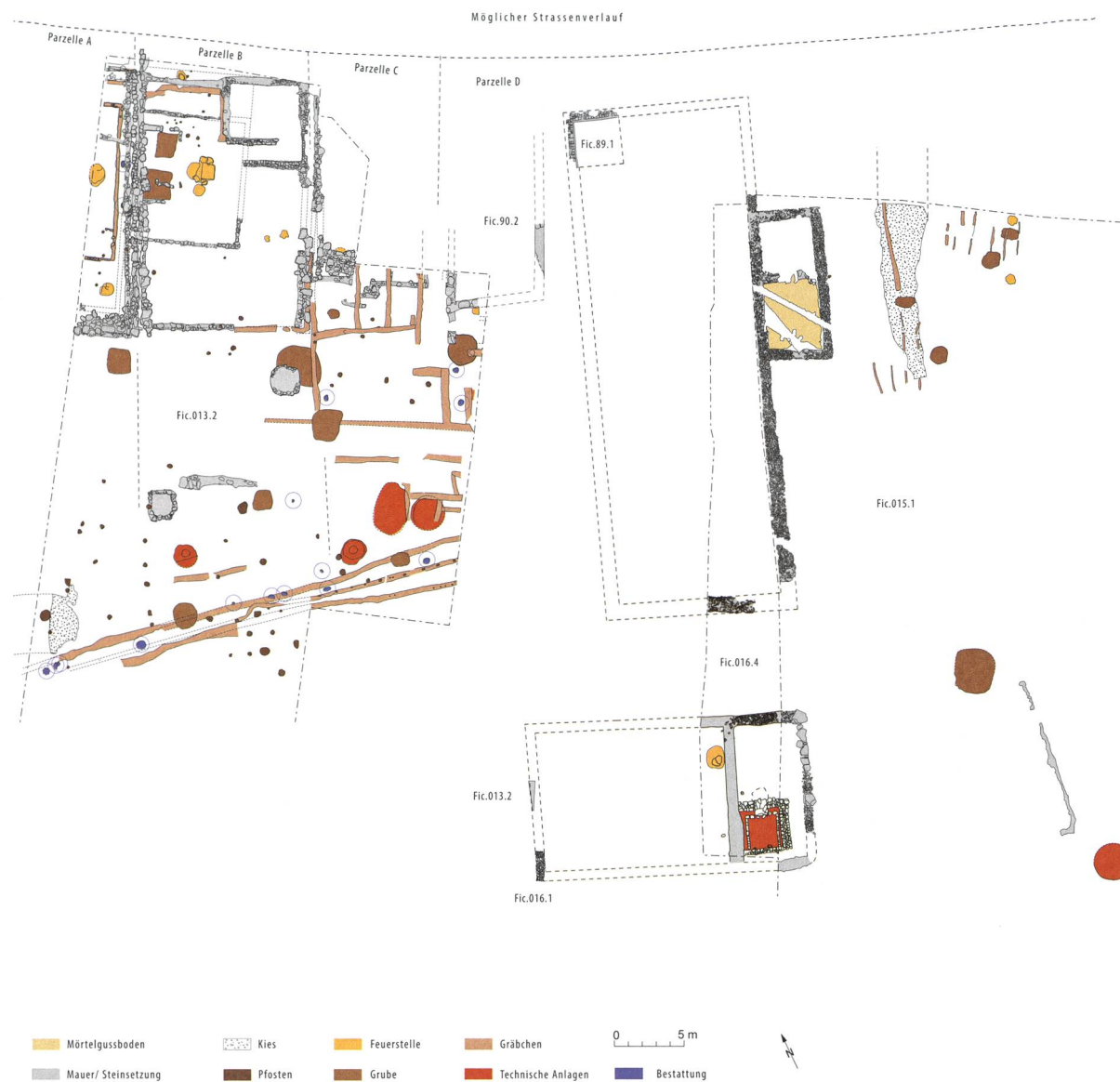
Frick-Gänsacker 2013-2014 (Fic.013.2), Frick-Ob em Dorf 2015 (Fic.015.1) und Frick-Ob em Dorf 2016 (Fic.016.4). Streifenhausbebauung und Gebäudekomplex.