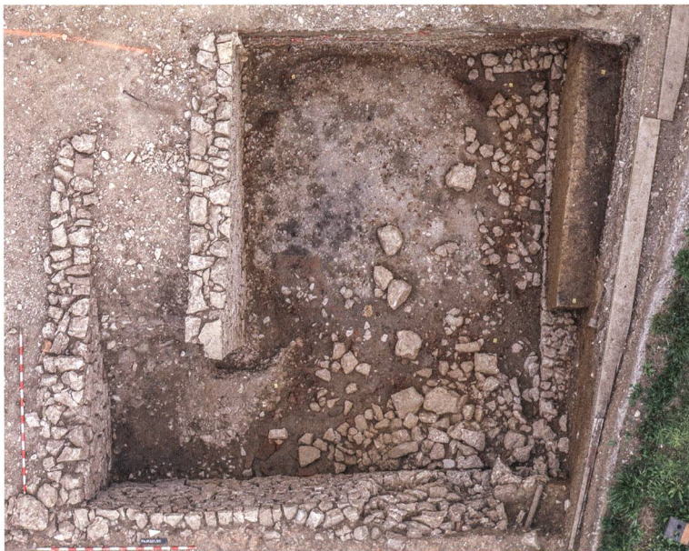
Frick-Gänsacker 2013-2014 (Fic.013.2). Der freigelegte Steinkeller.

In den dazugehörigen Hinterhöfen kamen Gruben, Schächte und technische Anlagen zum Vorschein. Die beiden Schächte waren rechteckig, mit Trockenmauerwerk eingefasst und bis zu 3.47 m tief.