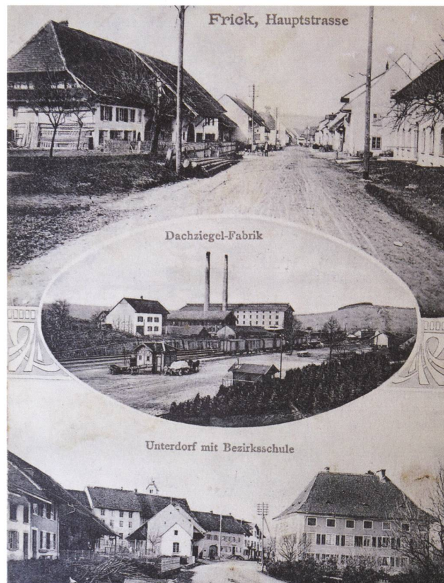
◁ Ums Jahr 1913 entstandene Ansichtskarte mit der 1944 abge- brannten Ziegelei in der Bildmitte.