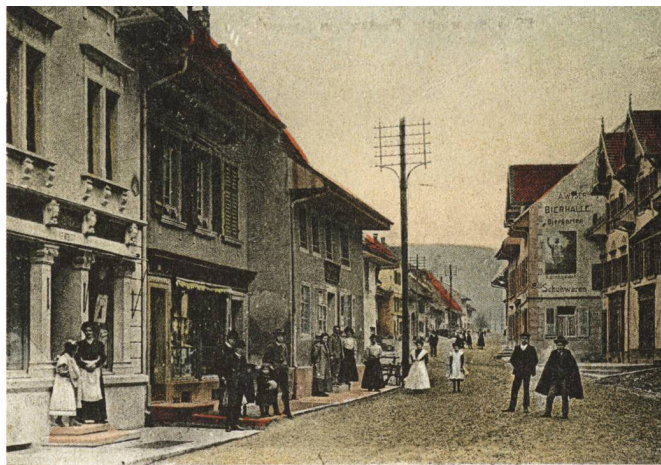
Gruss aus Frick (Ct. Aargau)