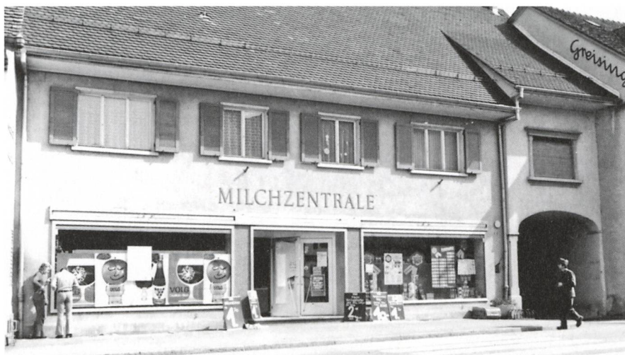
Der Neubau der Milchzentrale, bezogen im Jahr 1961.