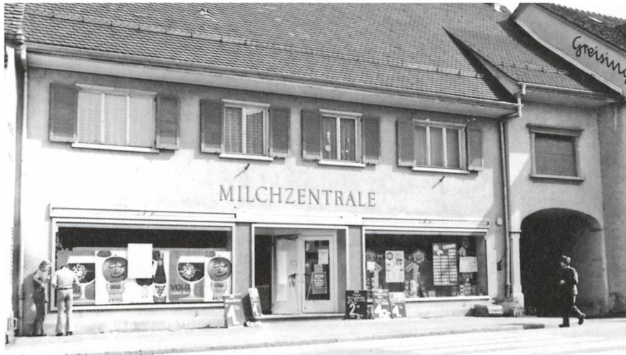
Der Neubau der Milchzentrale, bezogen im Jahr 1961.