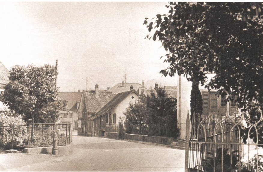
Das 1914 erbaute erste Milchhüsli an der Schulstrasse (Foto 1942).

Es gab immer noch Landwirte, die ihren Nachbarn direkt Milch verkauften und nur den Rest ins Milchhaus brachten. Das Nahrungsmittel «Milch» wurde rar.