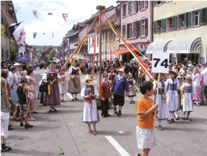
Impressionen vom Jodlerfest.