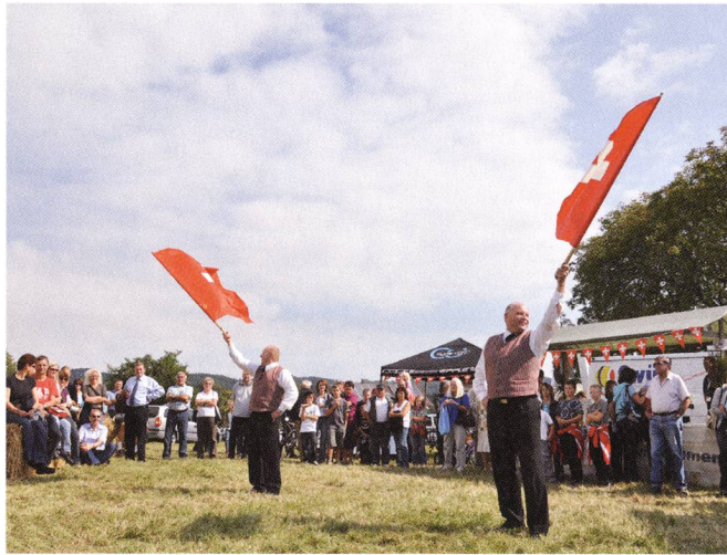
◁ Herbstmarkt und Schweizertag in Frickingen.