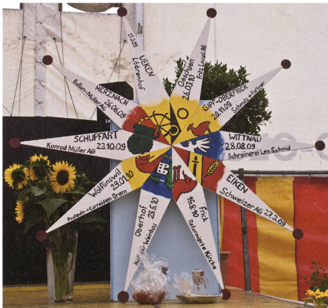
◁ Der Stern sym- bolisiert die 10 zugehörigen Orte der Kirchgemeinde (Stern-gottes- dienste).