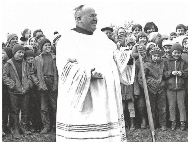
▷▷ Jubiläums- Jodlerabend.