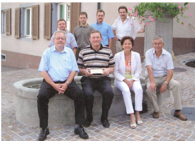
Einweihung des neu gestalteten Brunnenplatzes im Unterdorf.

pflanzt «Tonis Baum», eine Linde, zum runden Geburtstag des Gemeindeammanns.