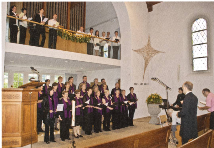
◁◁ Festgottesdienst: Joyfulvoices.ch und ungarischer Kirchenchor.