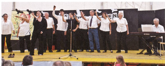
◁◁ Theaterprojekt Konfirmation einst und heute.