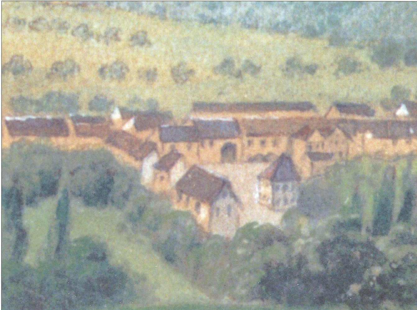
Der Marktplatz (Widenplatz) ums Jahr 1840.