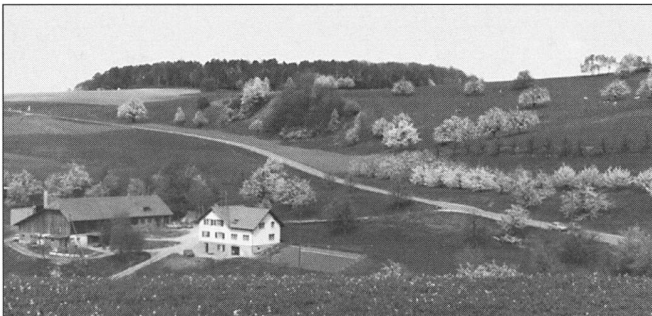
►► Der Bondelhof im Jahr 1937.