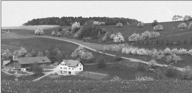
►► Der Bondelhof im Jahr 1937.