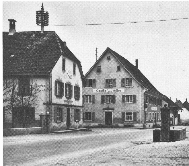
Postkartenansicht aus dem Jahre 1939

1 Fuder (im 15. Jahrhundert) = ca. 10 Hektoliter (1 badisches Fuder ab 1810 = 15 Hektoliter).