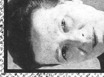
Simone de Beauvoir