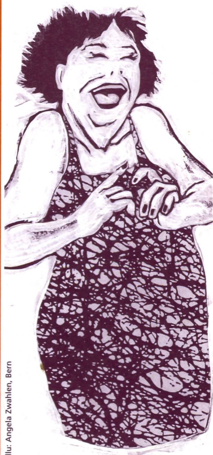
Illu: Angela Zwahlen, Bern