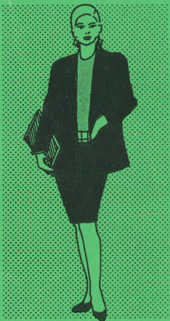
20 Jahre Frauenstimmrecht