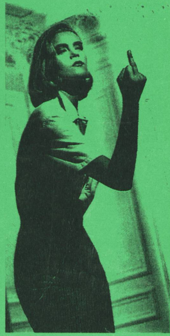
9,25 Jahre FRAZ

feiert mit UNS 4 mal im Jahr 52 Seiten frech, informativ, feministisch