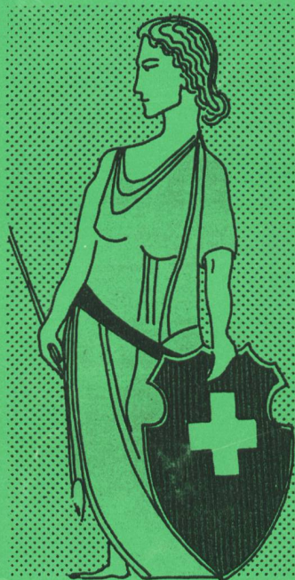
700 Jahre Eidgenossenschaft