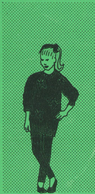
10 Jahre Gleichberechtigung