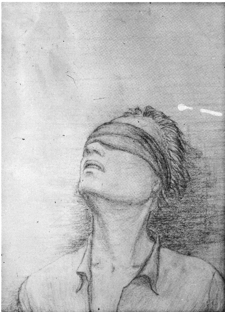
Im Gefängnis: Der Widerstand ist endlos.