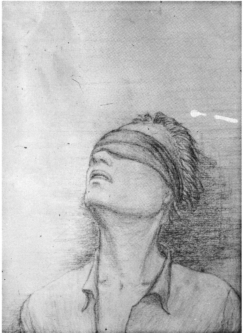
Im Gefängnis: Der Widerstand ist endlos.