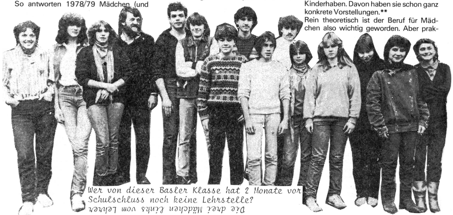
Wer von dieser Basler Klasse hat 2 Monate vor Schulschluss noch keine Lehrstelle? Die drei Mädchen links vom Lehrer

Rein theoretisch ist der Beruf für Mädchen also wichtig geworden. Aber prak-