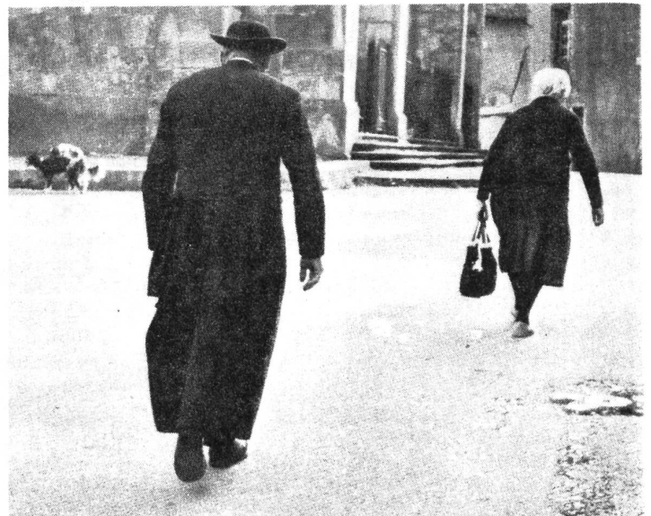
(1) Die "Asamblea de Mujeres de Vizcaya" wurde im Februar 1976 in der Illegalität gegründet.