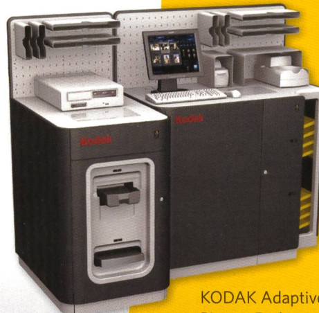
KODAK Adaptive Picture Exchange 74"