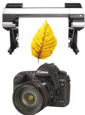
iPF9100: Canon EOS 5D Mark II + EF 24-105mm IS = CHF 4200.-