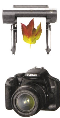
iPF6000S: EOS 450D + EF 18-55mm IS + EF 55-250mm USM + SanDisk SD 4,0 GB = CHF 1350.-

Offrez-vous le summum du grand format et une grosse récompense