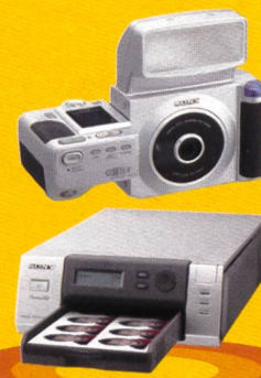
Sony Passbild UPX-C300