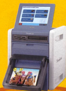
Sony SnapLab UP-CR20L