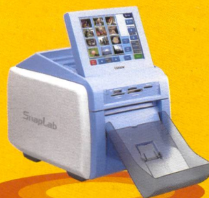
Sony SnapLab UP-CR10L