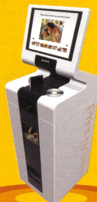
Sony Fotokiosk UPA-PC700