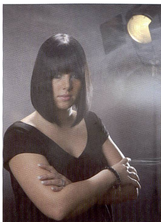
Un portrait réalisé en studio avec un éclairage contrasté ne pose aucun problème au capteur CMOS de l'EOS 5D Mark II.

SET de façon à libérer le déclencheur pour la prise de vue arrêtée. Deux fonctions méritent une mention particulière: les Picture Styles et le mode d'exposition Creative Auto (CA). Ce dernier permet à l'utilisateur de déterminer si le niveau de netteté de l'arrière-plan nécessite une correction – une fonction qui s'adresse clairement aux débutants peu experts dans le réglage de la focale. Les Picture Styles en revanche constituent une véritable alternative à l'enregistrement de fichiers RAW. Les photographes qui ne souhaitent