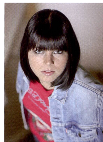
Même à 12 800 ISO, cette photo à lumière ambiante est étonnamment homogène et exempte de bruit. Vitesse: 1/250s, diaphragme 2,8.

En dernier lieu, Canon a modernisé le système d'alimentation. La nouvelle batterie LP-E6 1800 mAh remplace l'ancienne BP-511A. Ce nouveau modèle a une plus grande autonomie que l'ancien et un affichage amélioré du niveau de charge. Ainsi, l'EOS 5D Mark II indique plus précisé-