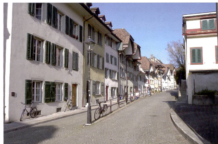
Le Nikon Coolpix P6000 est équipé du processeur d'image Expeed qui traite aussi les données dans les reflex Nikon D3, D700 et D300. Ici aussi, il a fallu sous-exposer légèrement pour récupérer toutes les lumières.

Le P6000 est le premier APN compact Canon à récepteur GPS intégré. Celui-ci enregistre la latitude et la longitude géographique précise du site de prise de vue sous forme de «géomarqueurs», sauvegardés dans les fichiers d'image (EXIF). Grâce à son groupe de lentilles mobiles, le stabilisateur d'image à réduction de vibration limite les effets des mouvements intempestifs de l'appareil et délivre en direct une