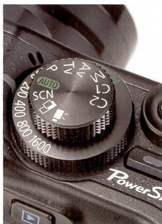
Classique: sur le Canon Powershot, la sensibilité ISO se règle par l'intermédiaire de la molette de réglage sur le dessus de l'appareil.

prise de vue; elle s'étend de 80 à 1'600 ISO, une fonction «Hi» pouvant être activée en «cas d'urgence». Le P6000 possède une plage de sensibilité de 64 à 2'000 ISO et permet également de réaliser des photos avec une résolution réduite (3 mégapixels) à 3'200 et 6'400 ISO. Nous avons réalisé des clichés à 1600 ISO avec les deux appareils et constaté un