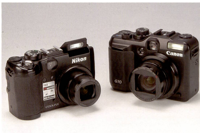
Le Canon Powershot G10 et le Nikon Coolpix P6000 proposent des fonctions professionnelles et s'adressent à des groupes d'utilisateurs différents: tandis que le G10 revendique son classicisme élégant, le P6000 mise sur le GPS voire les géomarqueurs et le téléchargement sur le Net.