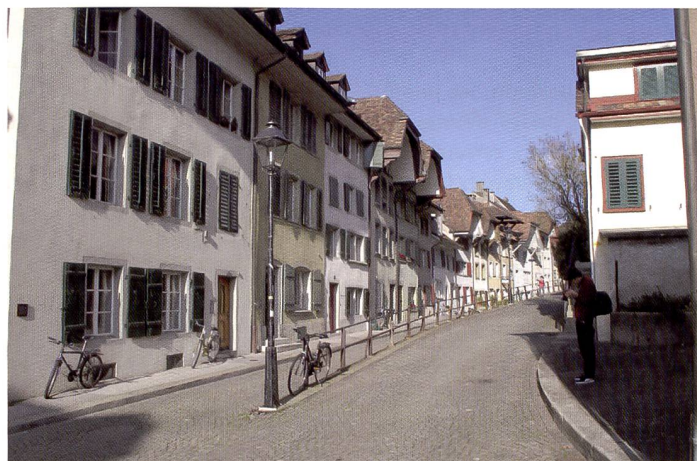
Dans les prises de vue comme celle-ci, le Canon Powershot G10 a eu tendance à surexposer légèrement les parties claires, ce qui s'est manifesté par des lumières délavées sur la façade blanche à droite. Une correction par diminution d'un tiers de focale a suffi pour remédier au problème.

Le câble LAN de l'ordinateur suffit pour établir la connexion. L'appareil indique que le transfert est terminé (avec succès), puis la connexion est automatiquement interrompue. Quelques minutes après le téléchargement, l'utilisateur reçoit un courriel le priant de compléter la création de son compte en fournissant les informations d'usage et un mot de passe.