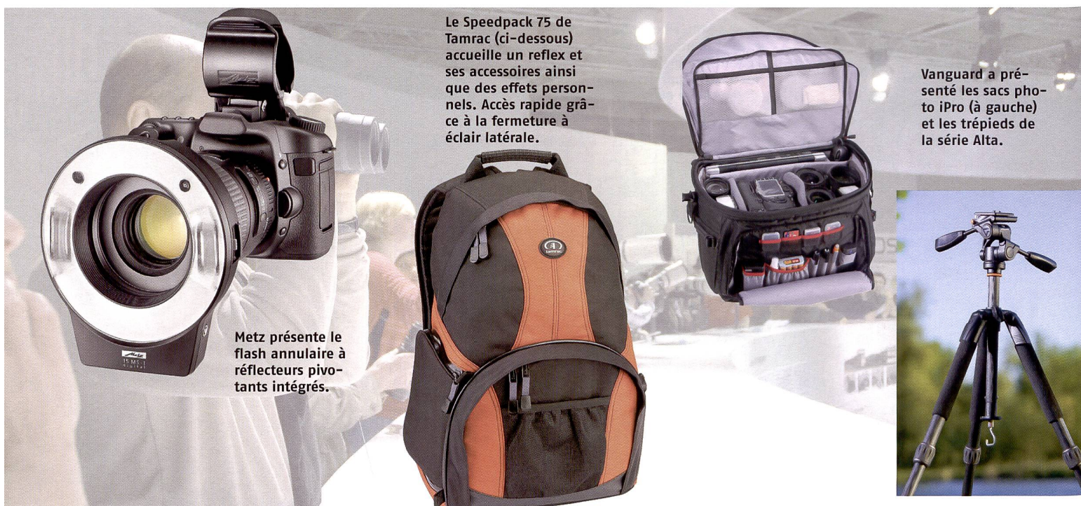
Le Speedpack 75 de Tamrac (ci-dessous) accueille un reflex et ses accessoires ainsi que des effets personnels. Accès rapide grâce à la fermeture à éclair latérale.

Erno lance Alta de Vanguard, une nouvelle gamme économique de trépieds. La colonne centrale est dotée d'une bague antichoc amortissant toute descente intempestive du mécanisme. L'extrémité inférieure de la