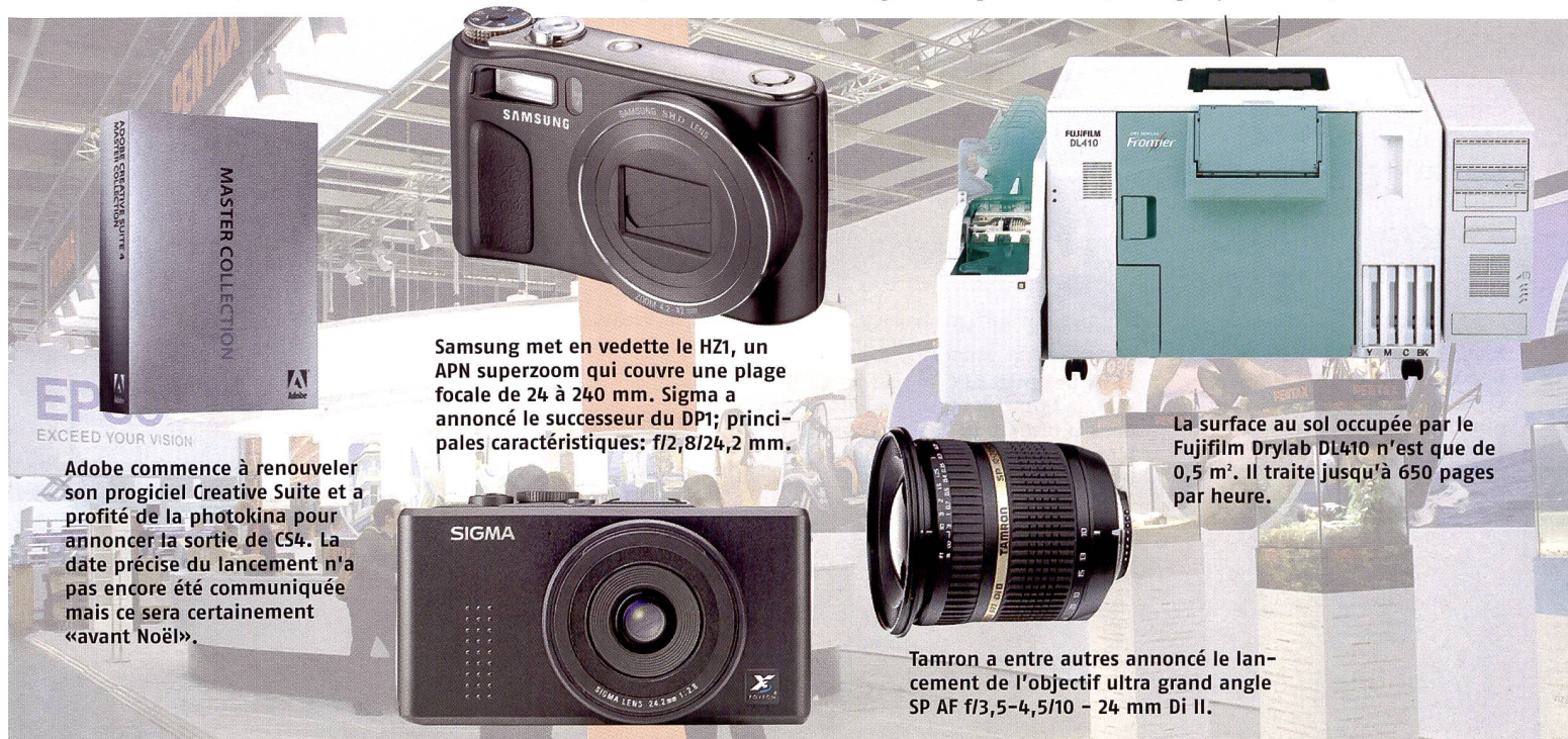
Samsung met en vedette le HZ1, un APN superzoom qui couvre une plage focale de 24 à 240 mm. Sigma a annoncé le successeur du DP1; principales caractéristiques: f/2,8/24,2 mm.

Avec un encombrement de 0,5 m2 seulement, le Fujifilm Drylab DL410 s'inscrit comme un modèle ultra compact qui peut même se loger sur un comptoir. Une fonction d'impression à grande vitesse délivre jusqu'à 650 pages par heure (format 4R: 152 x