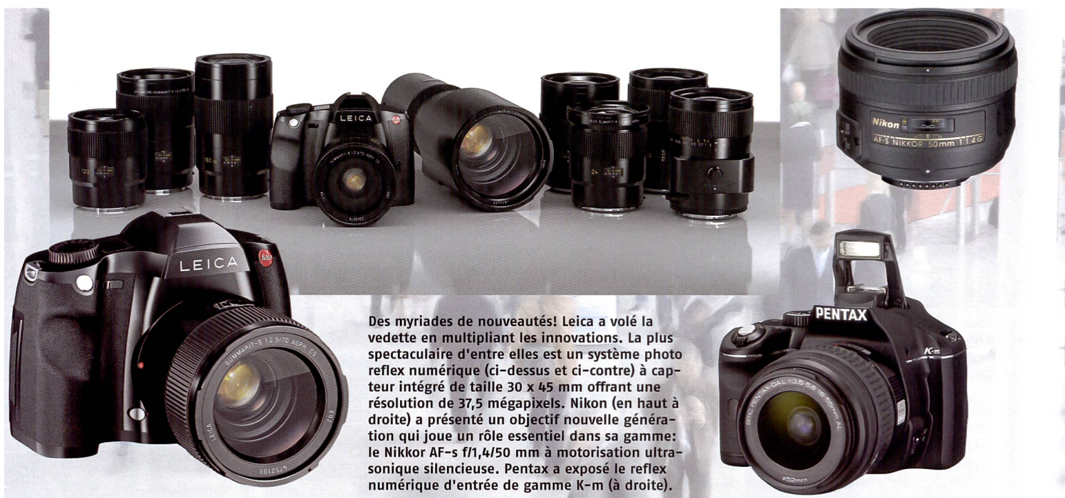
Des myriades de nouveautés! Leica a volé la vedette en multipliant les innovations. La plus spectaculaire d'entre elles est un système photo reflex numérique (ci-dessus et ci-contre) à capteur intégré de taille 30 x 45 mm offrant une résolution de 37,5 mégapixels. Nikon (en haut à droite) a présenté un objectif nouvelle génération qui joue un rôle essentiel dans sa gamme: le Nikkor AF-s f/1,4/50 mm à motorisation ultrasonique silencieuse. Pentax a exposé le reflex numérique d'entrée de gamme K-m (à droite).

mis au point pour monter le dos Mamiya 22 MP ZD Back sur les appareils professionnels 4x5". Il possède une coulisse pour le changement du dos Mamiya ZD Back et un viseur interchangeable. Ce dernier se monte directement sur le viseur fixe FW702 du système RZ 67 Mamiya. A l'aide du logiciel Mamiya Remote Capture, aussi bien le Mamiya ZD que le dos Ma-