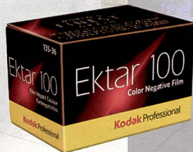
Nouvelle pellicule Kodak 100 ISO: pour séduire les photographes, l'Ektar 100 arbore «le grain le plus fin et le plus uniforme de tous les négatifs couleur actuellement sur le marché».