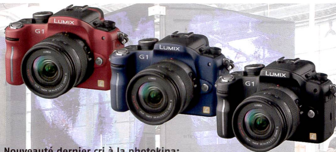
Nouveauté dernier cri à la photokina: le Panasonic Lumix G1 est le premier appareil recourant à la norme Micro Four Thirds. Il est proposé dans trois coloris et dispose d'un écran ACL orientable.