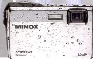
Ci-dessous: le Minox DC 8022 WP est étanche.

primé dans les tons mocca foncé, rehaussé par des armatures cuivrées et des applications imitation cuir qui lui confèrent un look contemporain. Selon leur taille, les sacoches Grenada comportent différents compartimentages intérieurs, boucle de ceinture, poignée de transport, bandoulière, poches latérales et diverses poches fermées par glissière.