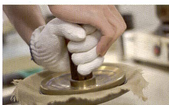
Le travail manuel et des contrôles rigoureux garantissent la qualité de tout premier ordre de l'objectif Zuiko Digital f/2,8/300mm (série TopPro). Prix: 12 000 CHF.

Compte tenu du savoir-faire opto-technique et de l'expérience des collaborateurs,