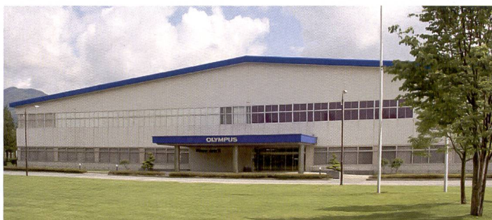
Extérieur discret, intérieur high-tech: manufacture Olympus de Tatsuno.

magnifique sur les montagnes Akashi et à l'ouest au milieu de la beauté naturelle des montagnes Kiso, se trouve ce que l'on considère comme le «cœur de l'imagerie Olympus» – l'usine de Tatsuno.