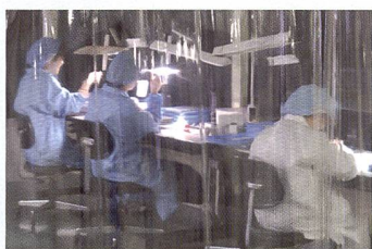
Tant le montage que le contrôle (photo) sont réalisés dans un environnement totalement exempt de poussière.

sont polis par les spécialistes les plus chevronnés. De plus les techniques de montage des objectifs faisant appel à la nanotechnologie utilisées par des ingénieurs spécialisés garantissent l'assemblage et le montage parfaits des lentilles et des montures de l'objectif.