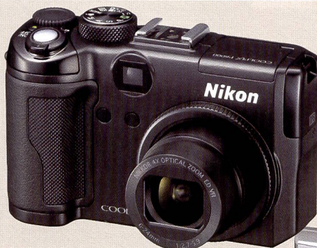
Le nouveau Nikon Coolpix P6000 avec GPS intégré et zoom 4x.