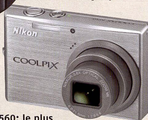
Coolpix S560: le plus petit de sa catégorie, mais avec un zoom 5x remarquable.