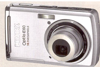
Le Pentax Optio E60 a été revisité pour séduire le marché. Ci-dessous: l'Optio M60, avec prise de vue en rafale à grande vitesse (5 mio. de pixels)