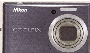
Le Coolpix 610c (en haut) a un temps de démarrage très court. Le Coolpix S710: 14,5 mio. de pixels et plage de sensibilité extensible jusqu'à 12 800 ISO.