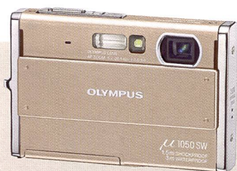
Olympus μ 1050: résistant et étanche.

Modèle d'entrée de gamme chez Pentax, le nouvel Optio E60 bénéficie de plusieurs évolutions pour séduire le marché: résolution élevée de 10 mégapixels, zoom grand angle léger équivalent 32 mm (petit format), sensibilité améliorée jusqu'à 6400 ISO et réduction numérique des vibrations. Pentax continue de miser sur des fonctionnalités pratiques comme une alimentation par deux piles ou accumulateurs de type AA (Mignon) disponibles partout dans le monde – la consumma-