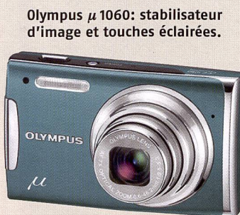
Olympus μ 1060: stabilisateur d'image et touches éclairées.