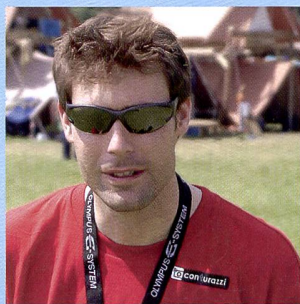
Mister E Christian Reding Spécialiste de