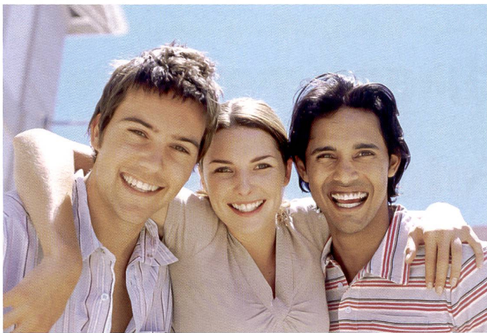
Avec détection des visages combinée à l'équilibrage des zones d'ombre.

La technologie d'équilibrage des zones d'ombre constitue un outil pratique lorsque les sujets photographiés présentent un contraste clair/obscur marqué. Elle optimise automatiquement la gradation des images de sorte qu'aucun détail ne disparaît dans le noir. Ce