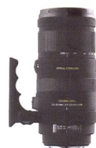
SIGMA APO-Zoom 120-400 mm F4,5-5,6 DG OS HSM

Les traitements les plus avancés appliqués à l'objectif éliminent les images parasites qui pourraient se former par réflexion à la surface du sensor et assurent un rendu des couleurs neutre sur toute la gamme focale. La distance minimum de mise au point de seulement 150 cm pour toutes les focales donne une échelle de reproduction maximum de 1:4,2. Le HSM (Hyper Sonic Motor) assure une mise au point rapide et silencieuse et permet, à tout instant, une intervention manuelle. Les éléments optiques de mise au point sont placés à l'intérieur de l'objectif ce qui rend aisément possible l'utilisation d'un filtre polarisant circulaire. De plus, la longueur de construction de l'objectif ne se modifie pas durant la mise au point.