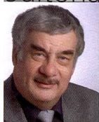
Urs Tillmanns Photographe, journaliste spécialisé et éditeur de Fotointern

Pour quelques 100 jeunes gens de Suisse, le début du mois de juin a marqué la fin d'une étape de vie importante en même temps que le début d'une autre: pendant trois ans, ils ont tout appris du métier de photographe et pourront désormais non seulement gagner leur vie grâce à cela, mais aussi vivre au jour le jour la fascination de la photographie. Le passage de l'apprentissage à la vie professionnelle n'est pas une mince affaire. Les exigences sont élevées car le nouvel employeur ou les clients attendront beaucoup de vous. Seuls ceux qui réalisent l'importance de la qualité et qui fournissent des prestations exceptionnelles ont des chances d'évoluer dans le monde actuel très dur des affaires et de gagner plus que la moyenne. Nous avons consacré une page du présent numéro à la procédure de qualification en Suisse Romande afin de vous montrer les meilleurs travaux. Et nous tenons, chers diplômés à vous féliciter pour votre réussite aux examens. Mais comme elle ne correspond pas seulement à la fin d'une étape de vie, mais aussi au début d'une autre, nous vous souhaitons également beaucoup de succès pour votre avenir professionnel.