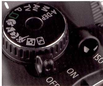
Les modèles pros renoncent à des modes scène (ici : EOS 450D).

cet agrandissement du viseur tout comme de sa meilleure luminosité. Mais les utilisateurs dotés d'une vision normale ne sont pas en reste. Composer des images devient un jeu d'enfants. Impossible de négliger le moindre détail. En termes de vitesse en revanche, l'EOS 450D est largement distancé par l'EOS 40D qui atteint 6,5 vues par secondes contre seulement 3,5 pour l'EOS 450 D. De plus, si la mémoire tampon du 40D peut contenir 17 images RAW, celle du 450D est saturée avec 6 vues. Pour le photographe moyen, cela ne pose aucun problème bien sûr, mais le professionnel se montre plus exigeant sur ce point car il ne veut pas courir le risque de manquer une scène importan-