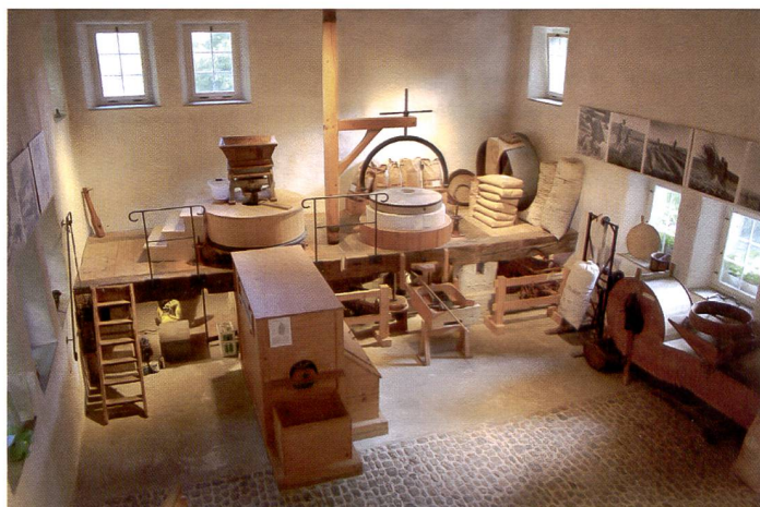
Le Canon EOS 450D a maîtrisé cette prise de vue intérieure (avec 800 ISO) sans aucun problème. Ci-dessous: l'autofocus a bien réagi et ne s'est pas laissé «irriter» par la présence de la vitre.

Sans doute que les photographes aguerris accordent-ils moins d'importance au mode Liveview. Mais la jeune génération qui a grandi avec les APN ne peut plus s'imaginer la photographie sans la fonction Liveview. Elle rend de précieux services non seulement en studio mais aussi dans les positions de prise de vue acrobatiques, p.ex. la macrophotographie au ras du sol ou lorsqu'il faut tenir l'appareil à bout de bras. En résumé, l'EOS 450D est très convivial et truffé de fonctionnalités normalement réservées aux