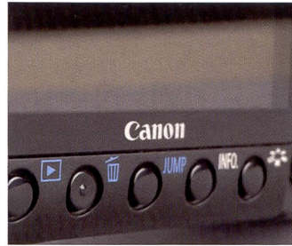
Le boîtier plus grand du 40D offre plus de place pour les commandes.

te lors d'un grand événement, une cérémonie de mariage par exemple. Quoi qu'il en soit : l'EOS 450D de Canon s'adresse aux photographes amateurs ambitieux à la recherche d'un «supplément» de fonctionnalités et de résolution. L'EOS 400D – un modèle un peu plus ancien et moins cher –